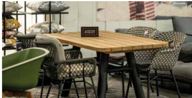
Von eleganten Lounge-Möbeln über Gartenbänke, -tische und -sessel bis zu Liegen, Hollywood-Schaukeln, Strandkörben und Zubehör reicht das Portfolio des Unternehmens.

Von eleganten Lounge-Möbeln über Gartenbänke, -tische und -sessel bis zu Liegen, Hollywood-Schaukeln, Sonnen-