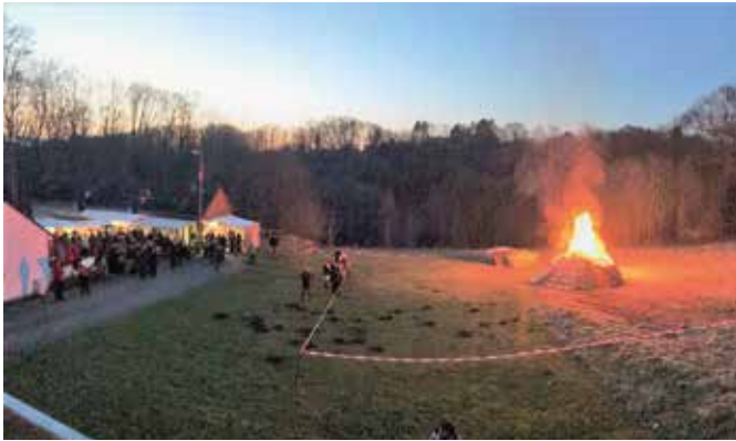
Ein beliebter Treffpunkt ist das Mittelstiepeler Osterfeuer, das am Gründonnerstag (28.3.) an der Ziegenbockstation in Stiepel entzündet wird.

Übrigens haben Interessierte während der Veranstaltung die Möglichkeit, Wildspezialitäten und Wildfleisch aus der Region zu erwerben. Erreichbar ist das Veranstaltungsgelände unter anderem mit dem Bogestra-Bus SB 37 Richtung Hattingen-Mitte (Haltestelle Kosterstraße).