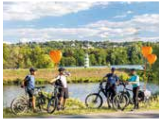
250.000 Euro schütten die Stadtwerke aus.

Aus dem Verbreitungsgebiet des Stiepeler Boten werden zwei Projekte unterstützt. In der Kategorie Sport erhält der SV BW Weitmar 09 eine Teilförderung. Damit soll das Vereinsheim am „Erbstollen Park“ (Roomersheide) saniert und zukunftssicher gemacht werden. Dabei geht es vor allem um Barrierefreiheit und moderne, zukunftsfähige Sanitär- und Heizanlagen. Wenn es finanziell darstellbar ist, möchte der Verein weiter in Energiesparmaßnahmen für das Vereinsheims investie-