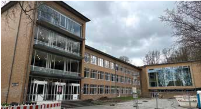
Die Graf-Engelbert-Schule im Ehrenfeld ist Wunsch-Schule vieler Stiepeler Schülerinnen und Schüler.

dem Bochumer Süden können nicht zur Wunsch-Schule