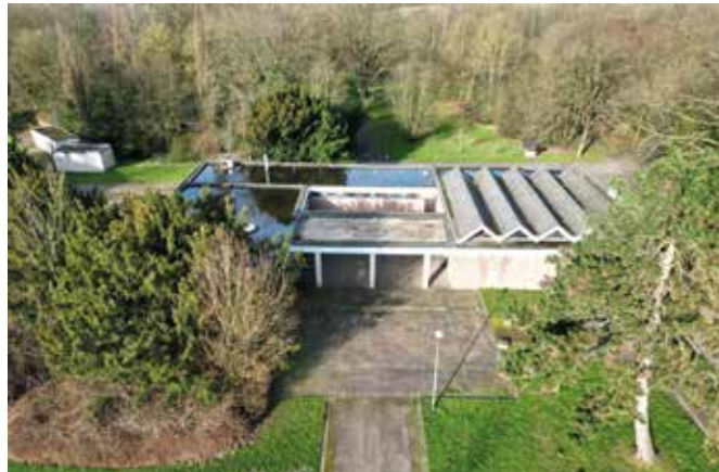
Das baufällige Gebäude auf dem Friedhof in Stiepel soll abgerissen werden. Ein Termin dafür steht noch nicht fest.

außer Betrieb genommen hat. Und da es ohnehin wenig genutzt wird, ist der Abriss die sinnvollste Lösung, so gerne wir alles erhalten würden. Aber anschließend müssen neue Toiletten errichtet werden“, stellt Maria Hagemeister klar.