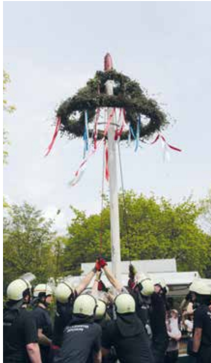
Im vergangenen Jahr hissten Mitglieder der Feuerwehr Stiepel den Maibaum an der Gräfin-Imma-Schule.