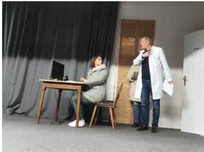
In die Zahnarztpraxis von Doktor Wenzel führt das neue Stück der Volksbühne Bochum, das im April und Mai im haus Spitz aufgeführt wird.

Nach ihrer letzten erfolgreichen Komödie und einer kleinen „Erholungspause“ proben die Akteure der Volksbühne Bochum schon wieder fleißig für das Frühjahrsstück. Von Ernas Kneipe, dem Schauplatz der zurückliegenden Aufführung, wechselt das Ensemble zu Dr. Wenzels Zahnarztpraxis und freut sich schon jetzt auf die kommenden Aufführungen im April und Mai. „Al Dente“ heißt das Stück von Hugo Rendler & Sigi Schwarz und ist eine „bissfeste“ Komödie in drei Akten. Zum Inhalt gibt es schon einmal dies zu sagen: An der Zahnarztpraxis von Doktor Wenzel nagt der Zahn der Zeit, wie auch an seiner Ehe mit Marie-Luise. Statt auffrischen: aufgeben, wie die