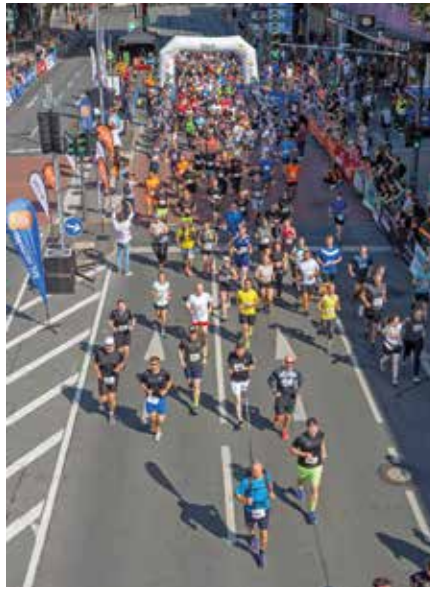
Läuferinnen und Läufer aller Altersklassen freuen sich auf den nächsten Bochumer Halbmarathon, der am 1. September stattfinden wird.

In Kooperation mit dem TV Wattenscheid 01 verlost der Stiepler Bote zwei kostenlose Halbmarathon-Starts. Lauf-Interessierte schicken eine E-Mail mit dem Stichwort