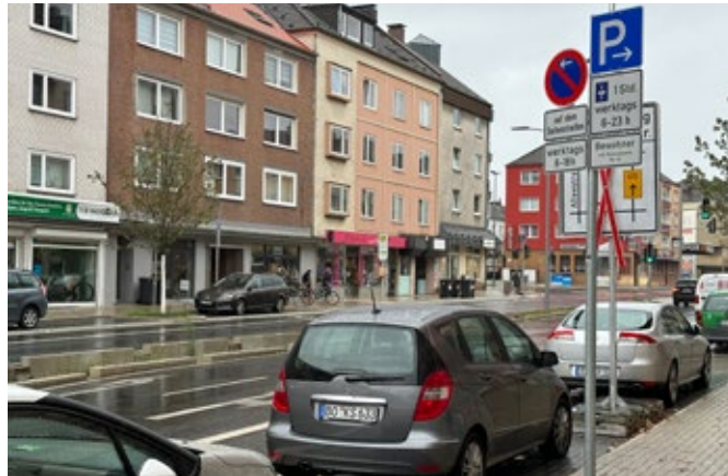
Nur eine Stunde mit Parkscheibe dürfen Autofahrer an der Hattinger Straße parken – und die Anlieferzone ist auch ständig zugeparkt.

Daniela Opalach und Annett Włodarczyk, Inhaberinnen des Friseurbetriebs „Aufgebrelzt“, hatten die Initiative