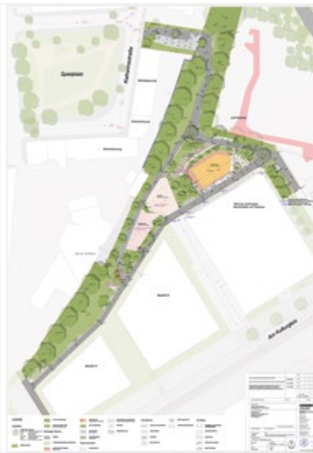
Der Sportpark wird in Geh-Abstand zum Ehrenfeld errichtet. Grafik: Stadt Bochum

Im integrierten städtebaulichen Entwicklungskonzept (ISEK) für die Innenstadt wird unter anderem die Entwicklung dieser öffentlichen