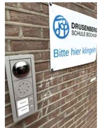
Per Klingel und Videosprechanlage erhalten Kinder Zugang zu den Toiletten.

sollen der Drusenbergschule zugeschlagen werden. Ein nahtloser Übergang – fünf Jahre Container, dann Umzug in die Brüder-Grimm-Schule – ist offen und beim Vergleich mit anderen Bauprojekten und deren Verzögerungen eher unwahrscheinlich.