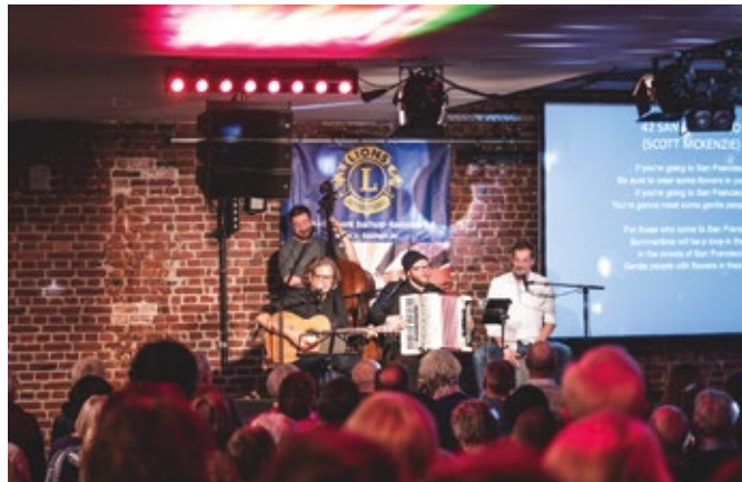
Gemeinsam singen und Gutes tun: Und wer dabei nicht textsicher ist, kann wie beim Karaoke vom Bildschirm ablesen.