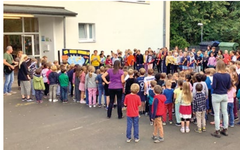
Mit großem Engagement beteiligte sich die Don-Bosco-Schule an der Kampagne „Kleine Klimaschützer unterwegs“.