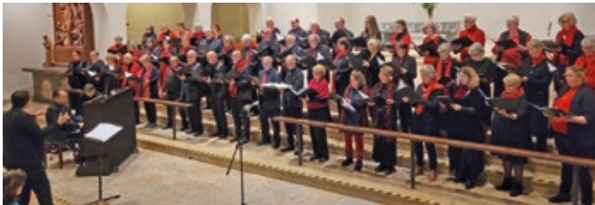
Der Profane Chor Bochum begeisterte mit seinem Konzert in der Kulturkirche Christ-König rund 300 Gäste.