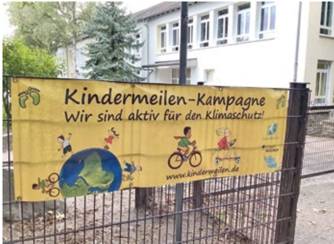
Aktiv für den Klimaschutz waren die Schülerinnen und Schüler der Don-Bosco-Schule im Rahmen einer Aktionswoche unterwegs.