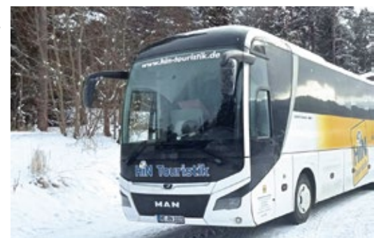
Mit dem Bus der HIN Touristik geht es komfortabel zu den weihnachtlichen Zielen.

auch auf weniger bekannten Weihnachtsmärkten. Buchen Sie noch heute und nutzen Sie die Winterzeit zu einer unvergesslichen Busreise! Preise und Buchungsmöglichkeiten finden Sie in nebenstehender Anzeige.