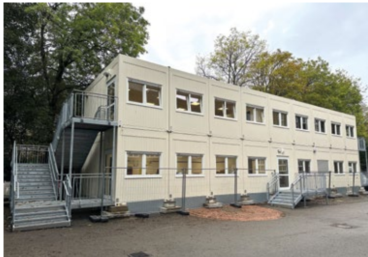
Beide vierten Klassen der Drusenbergschule werden nun in Containern unterrichtet.

Positiv ins Gewicht fällt sicherlich die Ausstattung der Klassenräume mit digitalen