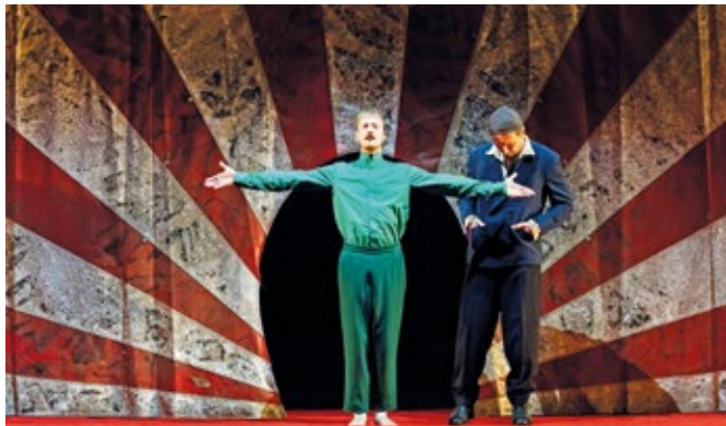
Das Schauspielhaus Bochum zeigt Woyzeck in der prämierten Inszenierung von Intendant Johan Simons.

Musiktheater bis Performance – das ‚RuhrBühnen-Spezial‘ verspricht eine Palette an kulturellen Erlebnissen, die so vielfältig ist wie die Region selbst. Wir laden vor allem auch dazu ein, die Theater über die eigene Stadtgrenze hinaus zu besuchen; so die Sprecher der RuhrBühnen,