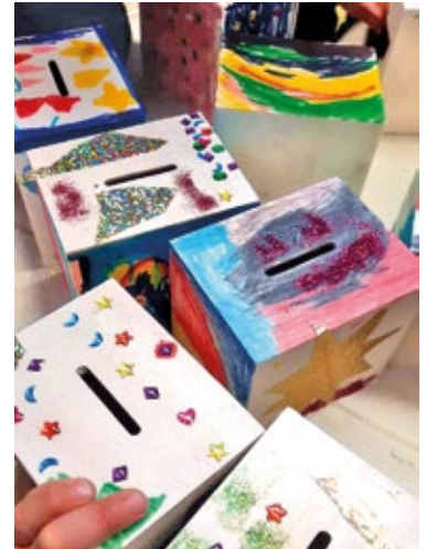
In diese Spardosen zahlten die Spenderinnen und Spender ein. Am Ende kamen über 1000 Euro zusammen.

Der Förderverein unterstützt weiterhin den Wunsch der Kinder, das Außengelände um eine Spielmöglichkeit zu erweitern. Da die KiTa Spielgeräte nach DIN-Norm benötigt, die fachmännisch eingebaut werden müssen, um den Sicherheitsstandards zu entsprechen und die TÜV-Abnahme