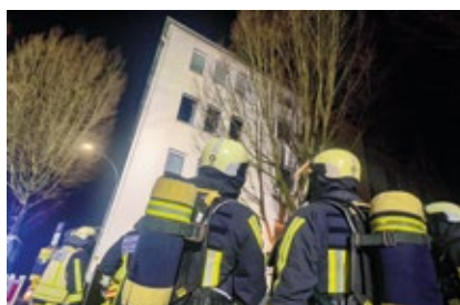
In einem Mehrfamilienhaus in der Dibergerstraße musste die Feuerwehr einen Küchenbrand löschen.

Um 20.58 Uhr meldeten mehrere Anrufer eine Rauchentwicklung aus einem Mehrfamilienhaus in der Dibergerstraße. Da sich noch Personen im Gebäude aufhalten sollten, wurden zwei Löschzüge der Berufsfeuerwehr sowie die Löscheinheit Bochum Mitte der Freiwilligen Feuerwehr zur Einsatzadresse beordert.