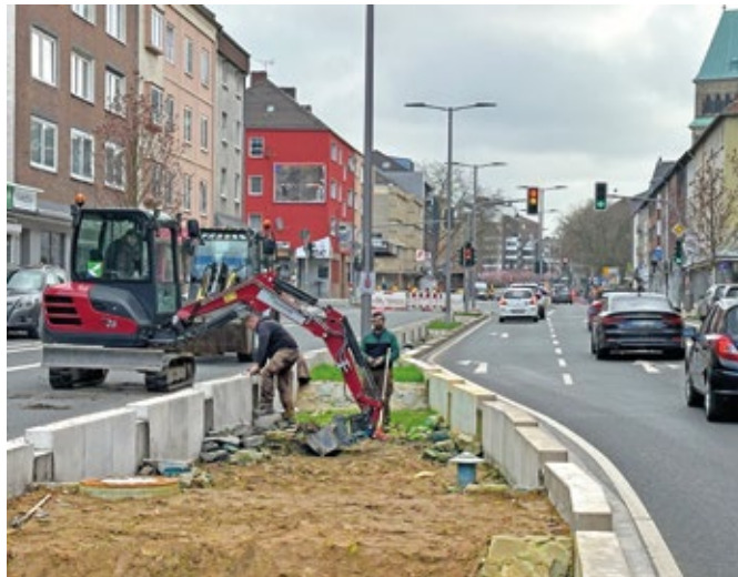
Die abschließenden Arbeiten auf der Hattinger Straße im Ehrenfeld laufen noch bis in den Monat April hinein.