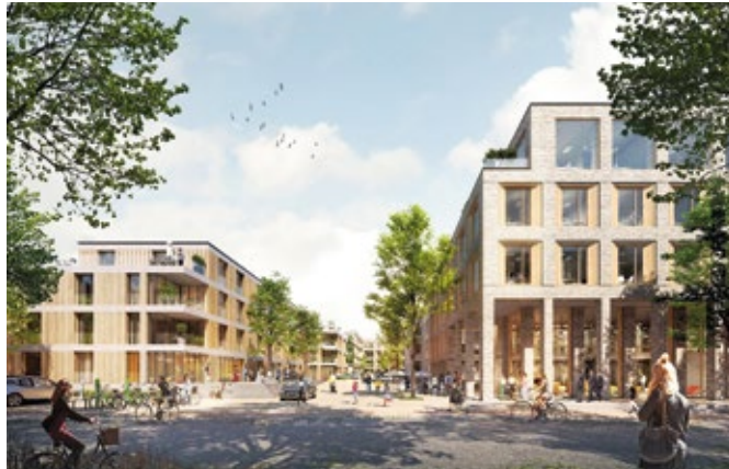
Das sogenannte „ParkViertel“ mit einem Mix aus Wohnen, Arbeiten und Natur ist Geschichte. Das Gelände wird weiter baureif gemacht und dann neu vermarktet.

Im Juli 2016 hatte die Bochum Wirtschaftsentwicklung das Grundstück von der Firma Jahnel-Kestermann erworben, um es neu zu entwickeln und anschließend zu