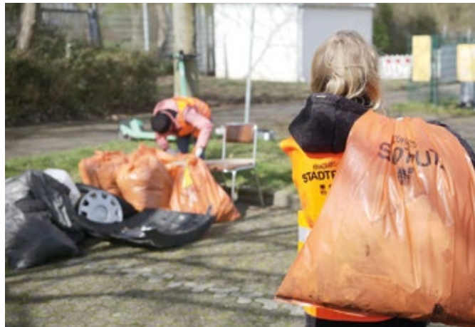
Helfende Hände aus allen Altersschichten sind willkommen, wenn am 20. April der Stadtputz über die Bühne geht.

Der Frühjahrs-Stadtputz in Bochum steht in den Startlöchern. Seit dem 15. Januar können sich Gruppen und Einzelpersonen aus allen Bochumer Stadtteilen für den großen Aufräumtag anmelden. Am Samstag, 20. April, haben alle Bürgerinnen und Bürger erneut die Möglichkeit, aktiv zu werden und gemeinsam ihre Stadt aufzuräumen. Die USB Bochum GmbH organisiert und koordiniert die Aktion und kümmert sich um die gesamte Abwicklung des Frühjahrs-Stadtputzes. Im vergangenen Jahr machten sich trotz schlechtem Wetter mehr als 10.000 Teilnehmerinnen und Teilnehmer auf den Weg, um Bochum von Abfällen zu befreien. Die Anmeldezahlen für dieses Jahr