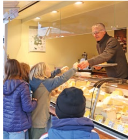
Die Drusenbergschüler erkundeten ihren Arbeitsplatz vor den Osterferien.