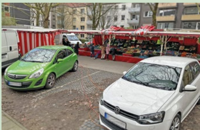
Auch diese beiden Fahrzeuge wurden nicht von der Stellfläche für die Markthändler entfernt.

Jeden Donnerstag bauen die Händler ihre Verkaufsstände im Herzen des Ehrenfeldes auf. Für die Zeit der Bauarbeiten haben sie den großen Parkplatz neben der eigentlichen Marktfläche zugeteilt bekommen. Zum Start gab es allerdings wieder einmal große Probleme. Besonders die Abstimmung mit der Stadt Bochum erwies sich