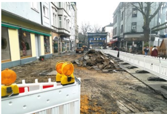
Noch bis Ende April dauern die Sanierungsarbeiten auf dem Hans-Ehrenberg-Platz. Mit der Bauausführung wurde eine Gala-Baufirma aus Münster beauftragt.

Seit dem 18. März saniert die Stadt die Oberfläche des Hans-Ehrenberg-Platzes, da die dortigen Schäden noch vor der geplanten Umgestaltung behoben werden müssen. Die Stadt pflastert den Platz neu und begradigt die Schotterschicht. Sechs Wochen Bauzeit sind angesetzt. Dafür wird der Platz in zwei Bauabschnitten je zur Hälfte gesperrt. Ein Problem für den Ehrenfelder Wochenmarkt, der jeden Donnerstag auf dem Platz stattfindet. Der Wochen-