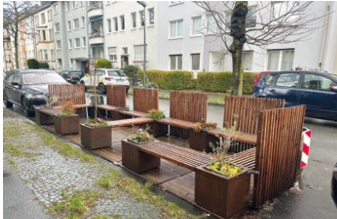
In der Schellstraße vor der Melanchthonkirche ist ein Parklet entstanden, das zum Verweilen und Ausruhen einlädt.

„In der Tat geht es darum zu erleben, was passiert, wenn wir die riesigen Flächen, die auf unseren Straßen durch Autos eingenommen werden, anders nutzen würden. Erlebbar wird, dass dieser ganze Einmündungsbereich der Schellstraße eigentlich ein lebenswerter Ort ist. Beim Parking-Day am 14. September konnten wir erste Eindrücke