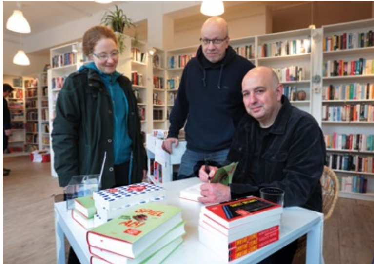
Autor und Kabarettist Frank Goosen signierte sein Bücher am 9. Dezember im Ehrenfelder bodo-Buchladen an der Königsallee 12.

Dort signierte Goosen Bücher und CDs. Fans brachten auch eigene Goosen-Werke von Zuhause mit oder erwarben sie kurz vor dem Signieren bei