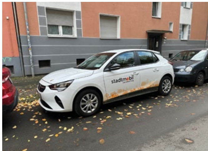
Ein Carsharing-Auto im Ehrenfelder Quartier an der Saladin-Schmitt-Straße.

Aus dieser Anfrage entstand dann im Nachgang ein Antrag, der die politischen Rahmenbedingungen so setzt, dass das Carsharing-Angebot in Bochum ausgeweitet und für Betreiber und Nutzer