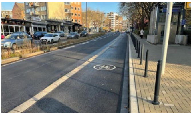
Die an der Hattinger Straße verlegten neuartigen Trennsteine müssen nach Ansicht der CDU einer Überprüfung unterzogen werden.

wenig erprobter Radweg engmaschig beobachtet werden muss. „Der Trennstein soll die Sicherheit der Radfahrer erhöhen“, erklärt Stefan Jox, „es sind erhebliche Zweifel angebracht, ob dieses Ziel erreicht wird.“