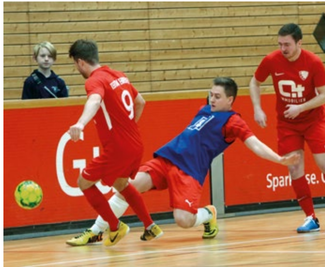
Die Fußballer der DJK Teutonia Ehrenfeld sind nicht nur auf dem Parkett aktiv, der Verein ist auch Ausrichter des Finalturniers.

Am Start sind auch die Titelverteidiger aus dem vergangenen Jahr: die DJK TuS