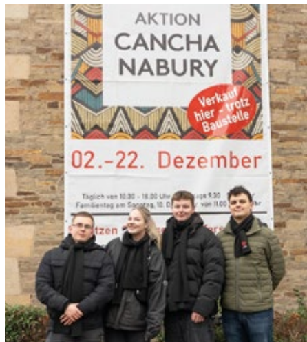
Kaufmännische Auszubildende von G DATA CyberDefense aus dem Ehrenfeld setzten sich mit einem Weihnachtsbaumverkauf für die „Aktion Canchanabury“ ein.

An zwei Tagen tauschten die G DATA-Azubis den Schreibtisch und die Berufsschule gegen den „Outdoor-Arbeits-