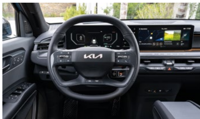
Der Kia EV9 ist nicht nur für den Fahrer konzipiert – er ist ein SUV für alle und bietet ein beispielloses Niveau bei Komfort, Platz, Zugänglichkeit und Technologien.