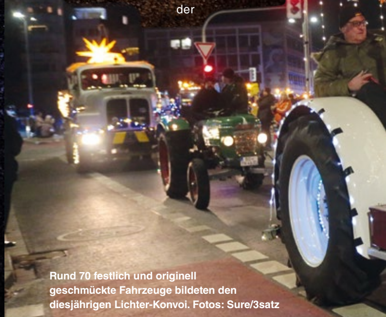
Rund 70 festlich und originell geschmückte Fahrzeuge bildeten den diesjährigen Lichter-Konvoi.

Den Termin hatten sich offensichtlich viele Interessierte in ihrem Kalender notiert, denn an vielen Stellen entlang der