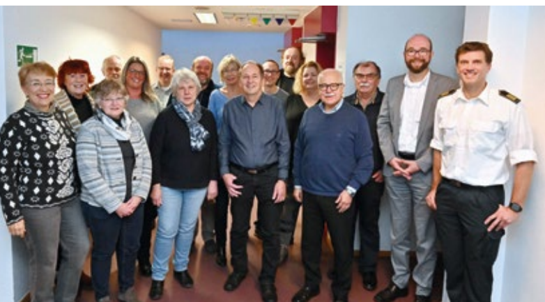
Die Schiedspersonen aus den 15 Bochumer Schiedsamtsbezirken trafen sich diesmal in der Hauptwache der Feuerwehr in Werne.

Informationen zur Funktion von Schiedspersonen sowie eine Liste der aktuell in Bochum tätigen Schiedsfrauen und -männer in den Bezirken finden sich im Internet unter www.ag-bochum.nrw.de/infos/streitschlichtung