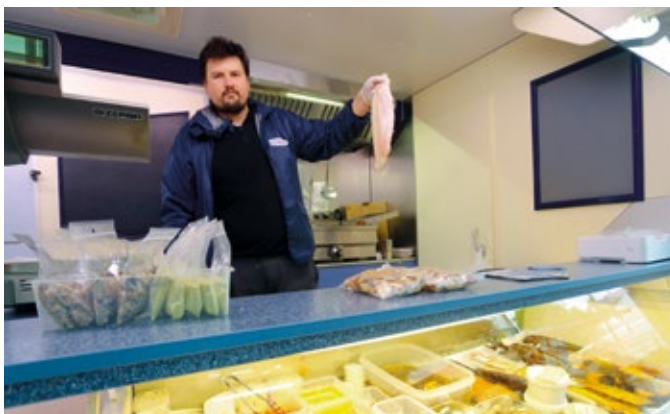
Karpfen und Winterkabeljau sind zu Weihnachten, Silvester und Neujahr sehr beliebt.