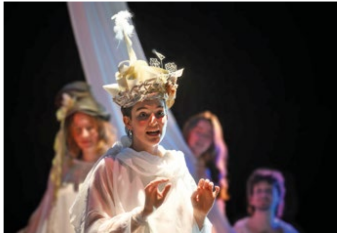
Während Shakespeares „Der Sturm“ noch bis Ende Januar über die Bühne fegt, ist der nächste Ausbildungs-Zyklus bereits in der Vorbereitung.

Was junge Menschen mit Interesse, Lust und Leidenschaft für den Schauspielberuf im Wortsinn auf die Bühne stellen, sieht ein immer wieder begeistertes Publikum aktuell beim Ehrenfelder Theater-Projekt TheaterTotal. Dort wird auch noch den Januar hindurch Shakespeares „Der Sturm“ aufgeführt – als ein beeindruckendes Theater-Erlebnis, das die jungen Auszubildenden des Projektes gerne mit ihren Zuschauern teilen.