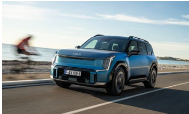
Das markante Erscheinungsbild des EV9 ist inspiriert von der Kia-Designphilosophie „Opposites United“ (Vereinte Gegensätze) und steht für ein kraftvolles und dennoch gelassenes Auftreten.

Das markante Erscheinungsbild des EV9 ist inspiriert von der Kia-Designphilosophie „Opposites United“ (Vereinte Gegensätze), deren Harmo-