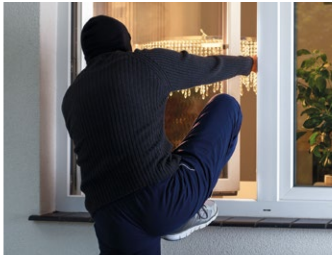
Fenster, Balkon- und Terrassentüren ohne Schutz sind für Einbrecher schnell zu überwinden.

Es gelte, Fenster, Balkon- und Terrassentüren immer ganz schließen. Denn: Gekippte Fenster sind offene Fenster. Nachbarn sollten Bescheid wissen, dass man unterwegs ist: Ein paar wachsame Augen seien ein guter Schutz. Die Polizei rät zudem: „Lassen Sie Ihre Nachbarn Ihren Briefkästen leeren oder veranlassen Sie eine Postlagerung: Volle Briefkästen signalisieren längere Abwesenheiten. Nutzen Sie Zeitschaltuhren für Radios und Beleuchtung – auch dauerhaft geschlossene Jalousien wirken auf Einbrecher ein-