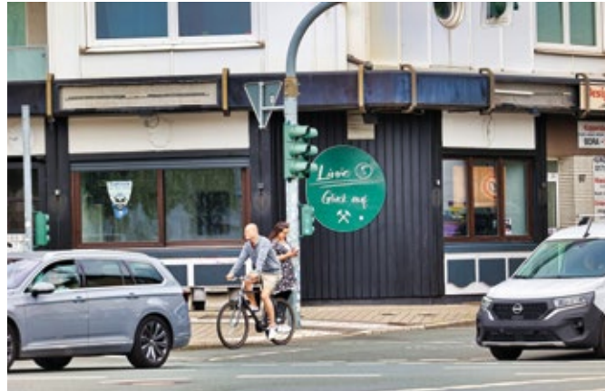
Bei einem Treffen in der Kneipe „Linie 5“ identifizierte der Staatsschutz Mitglieder der rechten Szene.