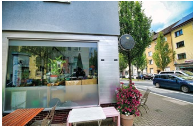
Das beliebte Ehrenfelder Café „Fräulein Coffea“ war am 30. Juni Schauplatz des Säure-Anschlags, der Bochum in die Schlagzeilen brachte.

Der Tatverdächtige konnte zunächst fliehen, wurde aber später im Nahbereich festgenommen. Bei dem Mann handelt es sich um einen 43-jährigen Deutschen aus Bergkamen. Noch in der Nacht wurde die Wohnung des Mannes in Bergkamen durchsucht. Das Motiv für die abscheuliche Tat ist nach wie vor unklar, von dem Verdächtigen gibt es bislang keine Aussagen dazu. Der Verdächtige soll bereits wegen Drogen- und Gewaltdelikten vorbestraft sein. Der 43-jährige Mann sitzt weiter in Haft. Es wurde Haftbefehl wegen des dringenden Tatverdachts des versuchten Mordes erlassen. Die Ermittlungen der eingesetzten