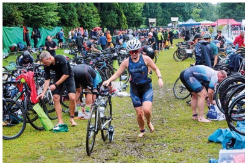
Die Zuschauer konnten sich bei den Wetterkapriolen mit Regenschirmen schützen, während die Athletinnen und Athleten mit den schwierigen Bedingungen zu kämpfen hatten. Matschig und nass war es in der Wechselzone im Wiesental-Bad.