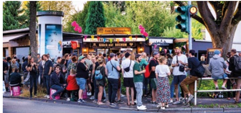
2022 gehörte auch der Kiosk Zum Philosophen (Ecke Drusenbergstraße/Hunscheidtstraße) zu einem der Orte beim Tag der Trinkhallen.

Die Trinkhalle „Zum Philosophen“ (Hubertusstraße 4, dienstags bis sonntags ab 12 Uhr) ist seit Jahren eine feste Institution im Ehrenfeld. Der Standort am Shakespeare-Platz, direkt am Schau-