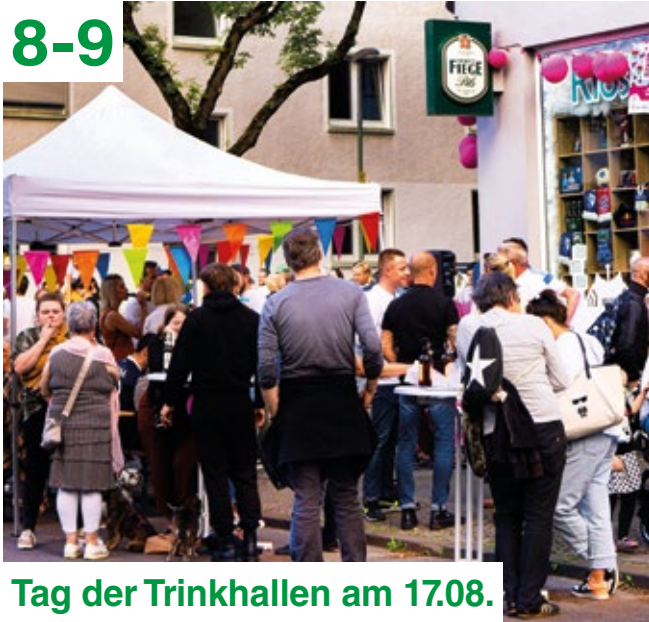
Tag der Trinkhallen am 17.08.