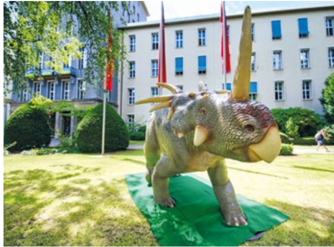
Ein 6,20 Meter langer Styracosaurus steht mit seinem Nasenhorn und Hörnern am Rand des Nackenschilds im Ehrenfeld.