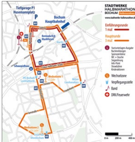
Die Grafik zeigt den Streckenverlauf des Halbmarathons, der hauptsächlich durch das Ehrenfeld führt.

Die Anlieger wurden rechtzeitig vom Veranstalter darauf hingewiesen, dass einige Straßensperren und Parkverbots-Zonen eingerichtet werden, um einen reibungslosen Ablauf gewährleisten zu können. Die Viktoriastraße ab Ecke Südring bis KAP-Bühne ist bereits ab 4.30 Uhr bis ca. 16 Uhr gesperrt. Die Vollsperrung der Laufstrecke erfolgt ab 6 Uhr (bis 16 Uhr). Folgende Straßen werden abgebunden: Meinolphusstraße, Schulze-Delitzsch-Weg, Knüwerweg Zufahrt REWE von der Oskar-Hoffmann-Straße. Folgende Straßen werden während der Veranstaltung eingeschlossen (ein Verlassen ist nur über vorgegebene