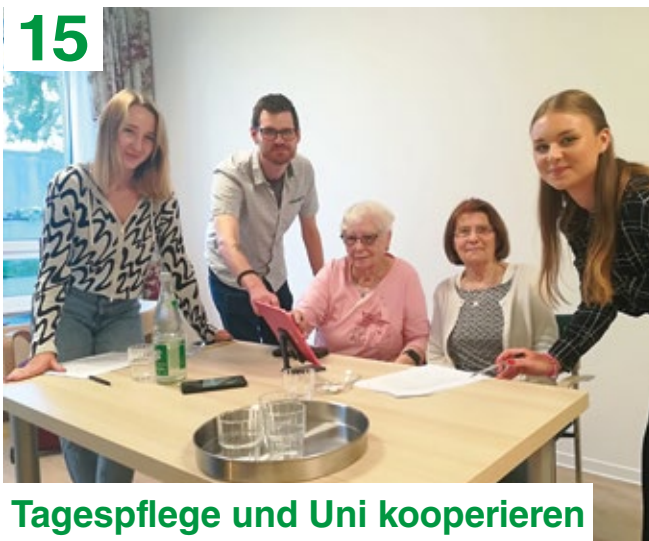
Tagespflege und Uni kooperieren