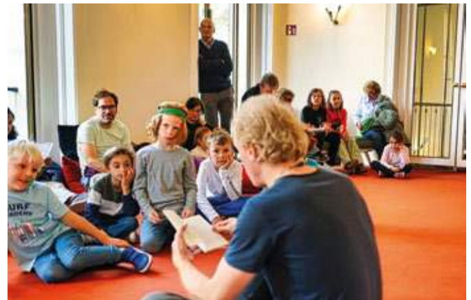
Auch der Bochumer Bundesliga-Trainer Peter Zeidler (stehend) schaute im Schauspielhaus vorbei.

und Alt – und bespielte das gesamte Schauspielhaus: einschließlich der Kammerspiele, des Oval Office und auch Orte, die sonst für das Publikum nicht zugänglich sind. So konnten Gäste auch die gewaltige Bühnenmaschinerie des Theaters erleben. Zu den Klassikern des Theaterfestes gehörte der Kostümverkauf im oberen Foyer. Eine Premiere war dagegen die Beteiligung verschiedener Ehrenfelder Firmen und Institutionen. Unter dem Motto „Ehrenfelder Nachbarschaft“ waren unter anderem das Straßenmagazin bodo, die Buchhandlung Mirhoff+Fischer, das Ehrenfelder Mit-einander sowie das Team unseres 3Satz-Verlags (mit Fotoaktion mit echten Requisiten) eingeladen.