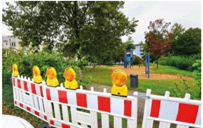
Der Spielplatz am Knüwerweg war Schauplatz eines Unfalls, den ein 90-jähriger Senior verursachte.

Frank Lemanis: „Wir regen über das Straßenverkehrsamt an, die körperliche und charakterliche Eignung des Unfallfahrers überprüfen zu lassen.“ Die Feuerwehr, der Kommunale Ordnungsdienst und das Tiefbauamt beseitigten die Schäden auf dem Spielplatz.