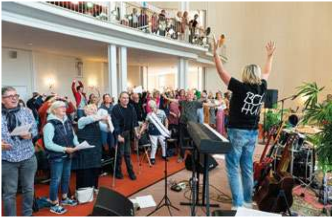
Viele Gäste zogen wie in den vergangenen Jahren das Theaterfest des Schauspielhauses Bochum an.

Theaterfest den Start in die neue Spielzeit 2024/25