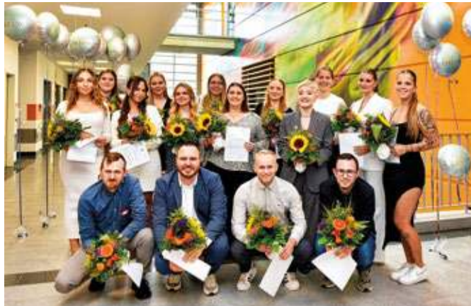
Die glücklichen Absolventinnen und Absolventen der Pflegeausbildung im Bergmannsheil.

Nun starten sie als frisch examinierte Gesundheits- und Krankenpflegerinnen und -pfleger in das Berufsleben. Alle 17 Examinierten bleiben dem Bergmannsheil treu und verstärken den Pflegedienst