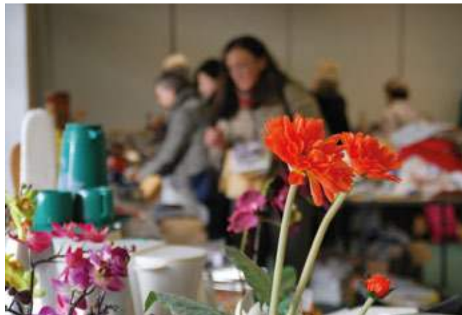
Nach besonderen Schätzen suchen und gleichzeitig die Atmosphäre im Hospiz kennenlernen können Interessierte bei den Tagen der offenen Tür.

Anders als in den Vorjahren fällt das Wochenende nicht mit der Zeitumstellung zusammen und bietet schon drei Wochen früher die Möglichkeit zum Stöbern und Entdecken. Nachdem der Flohmarkt im vergangenen Jahr unter