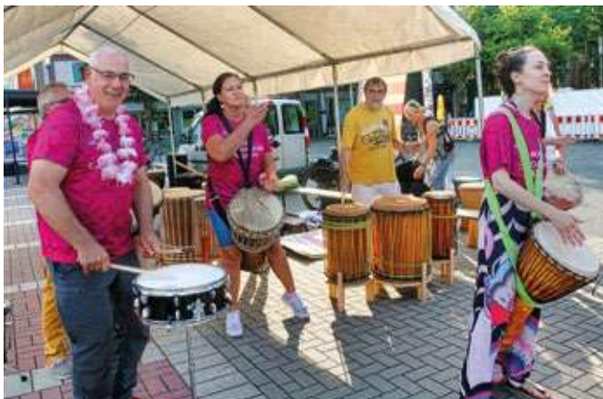
Vor dem Schauspielhaus wurden die Aktiven mit flotten Trommel-Rhythmen unterstützt.

Alle Ergebnisse können online unter www.my.raceresult.com nachgelesen werden. Nach dem Stadtwerke Halbmarathon ist wie immer vor dem Stadtwerke Halbmarathon. Die 13. Ausgabe ist längst in Planung und bereits angemeldet, der Termin steht: Am 7. September 2025 wird das Ehrenfeld wieder zum Schauplatz des Lauf-Events werden.