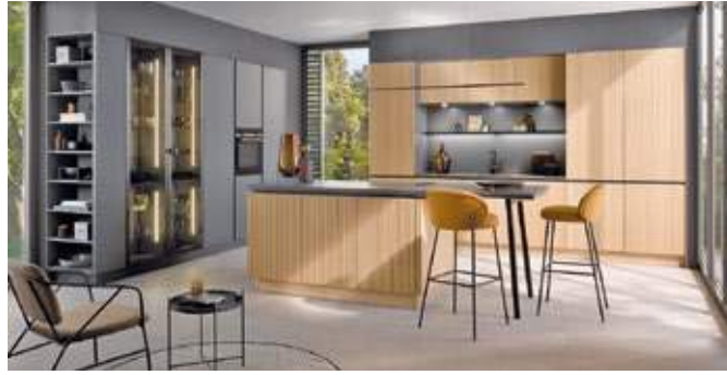
Küchen Rochol macht auch Ihren Küchentraum wahr.

Dadurch kommen Sie sofort nach dem Ende der Hersteller-Präsentationen in den Genuss, sich sowohl optisch als auch haptisch einen Eindruck von den hochwertigen Neuheiten machen zu können. Und dank der Vorreiterschaft kommen Sie bei Küchen Rochol gleich doppelt auf ihre Kosten - denn im Oktober legt das Familien-Unternehmen mit starken Preisvorteilen nach: Sichern Sie sich die Neuheiten 2025 zu den Messe-Konditionen der Hersteller! Vom 2. bis 18. Oktober lädt