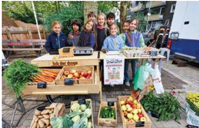
Vor der Winterpause übernehmen die 4a und 4b der Don-Bosco-Schule am 10. und 31.10. den WoMaKids-Stand.