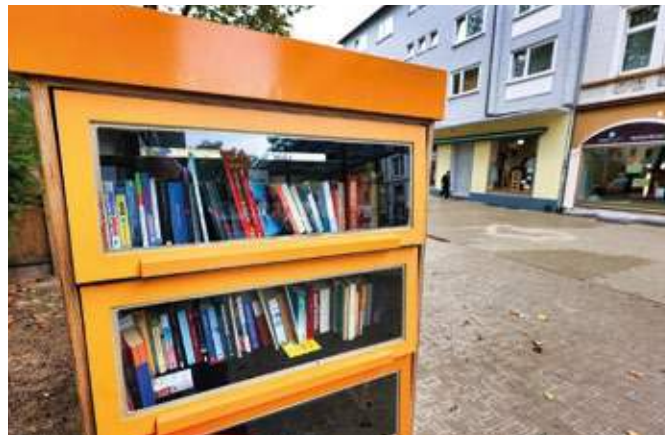
Seit Ende August ist der USB-Bücherschrank zurück im Ehrenfeld.

Auch für Schüler ist das Angebot im Schrank interessant. Es sind u.a. Wörterbücher für Französisch und Latein sowie mehrere Bände „Große Chronik – Weltgeschichte“ zu finden. Zurück in den Schrank kam nach einer einwöchigen Leihe durch unsere Redaktion das über 600 Seiten starke Sachbuch „Alles über Digitale Fotografie“. Überwiegend