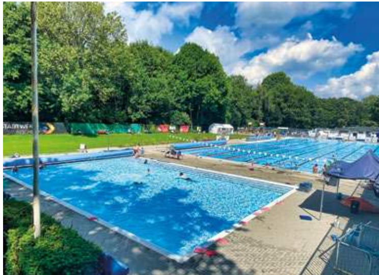
Das vom SV BW Bochum betriebene Wiesental-Bad soll auf regenerative Energieproduktion umgestellt werden.

Die Finanzierung von insgesamt ca. 1,5 Millionen Euro setzt sich aus mehreren Modulen zusammen: Von der GLS Bank gibt es ein Ver-