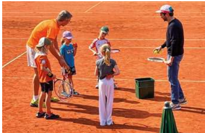
Eine kostenlose Trainingsstunde erhielten Kinder des TC Rechen von den Bundesliga-Herren des Vereins.

Das Training wurden gut angenommen. Gut 30 Mädchen, Jungen und sogar Erwachsene machten mit. Das berichtete Vorstandsmitglied Klaus Forch: „Fünf unserer Bundesliga-Cracks vermittelten ihre