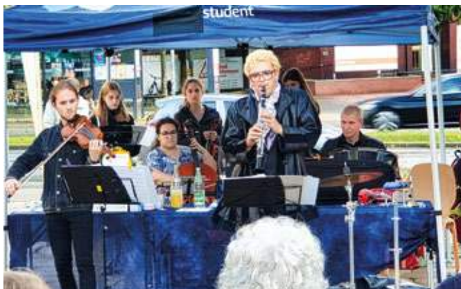
Beim Geburtstagsempfang auf dem Tana-Schanzara-Platz spielte die Klezmer-Gruppe FREYLEKHS der Musikschule.

Mitte September wurde auf den Geburtstag bei einem kleinen Empfang auf dem Tana-Schanzara-Platz trotz Regenschauer am Freitagabend angestoßen. Begleitet wurde die Veranstaltung von der Klezmer-Gruppe FREYLEKHS der Musikschule Bochum, die die Feiernden beschwingt in die Zukunft bewegte und den blauen Himmel zurückbrachte. Tags darauf, am Samstag, ging es gleich weiter mit dem Nachbarschaftsfrühstück im