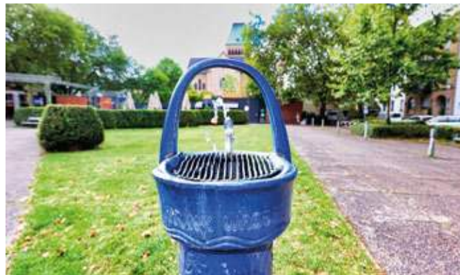
Der blaue Wasserspender im Ehrenfeld auf dem Shakespeare-Platz wird bald verschwinden und durch einen modernen auf dem Tana-Schanzara-Platz ersetzt.

Das neue Brunnen-Modell der Firma Kalkmann aus Bodenburg (bei Hildesheim/ Niedersachsen) besteht aus robusten und gut zu reinigenden Edelstahlkörpern. Die Anschaffungskosten belaufen sich auf 6500 Euro pro Stück – ohne den finanziellen Aufwand für Tiefbau und Installation. Mit einer Höhe von rund einem Meter ist der Auslass auch für Kinder und Menschen mit Einschränkungen gut zu erreichen. Die öffentlichen Wasserspender sind für