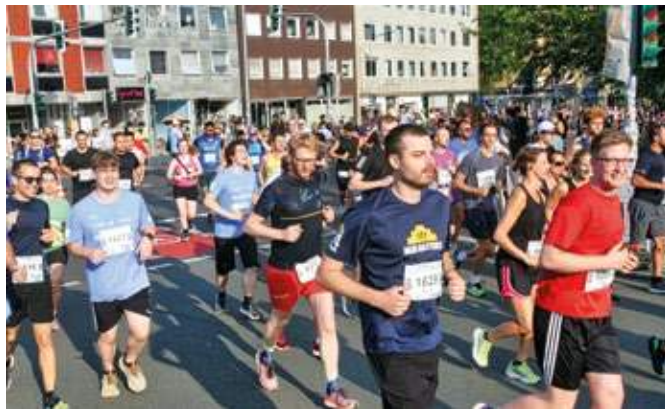
Bei herrlichem Wetter machten sich viele Läuferinnen und Läufer auf die Strecke durch das Ehrenfeld.

Eine Einschränkung aber gab es: Das Wetter setzte einigen Teilnehmern doch arg zu. Bei extrem hohen Temperaturen und ebenso hoher Luftfeuchtigkeit hatte das Deutsche Rote Kreuz einige Einsätze zu verzeichnen, ebenso wie Feuerwehr und der Malteser-Hilfsdienst. „Das bleibt bei einer solchen Wetterlage und einer Laufveranstaltung leider