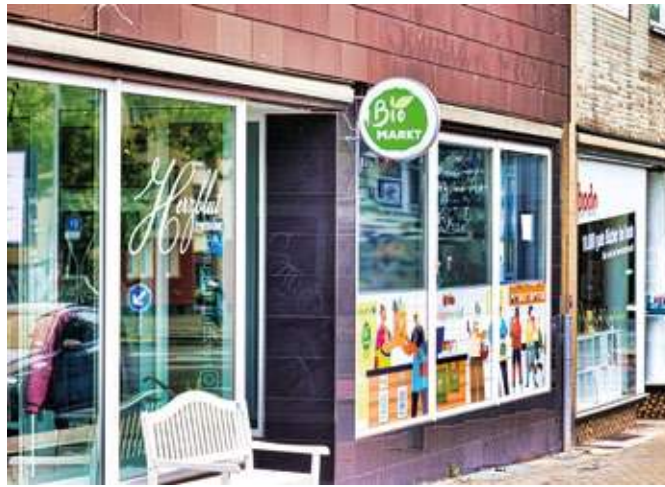
An der Königsallee gibt es jetzt einen Bio-Markt – direkt neben dem Friseur Herzblut.

In den Regalen des Geschäfts an der Königsallee 14 – das von Friseur Herzblut und dem bodo-Buchladen flankiert wird – stehen u.a. Trockenfrüchte in Form von Äpfeln, Mangos, Cranberries und Erdbeeren – in ganzen Stücken, in Schei-