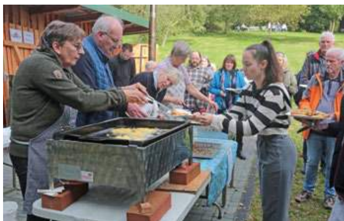
Reißenden Absatz fanden zu Beginn des Apfefestes die Reibekuchen – wahlweise mit Apfelmus.