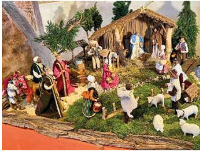
Die Krippe in der Dorfkirche hat Figuren „Santons de Provence“ – ist aber keine provenzalische Krippe.

Die Stiepler Dorfkirche hat seit 2023 in der Adventzeit wieder eine Krippe. „Zuvor war die Nordapsis einige Zeit leer geblieben“, berichtete Hans-Peter Neumann vom Offene-Kirche-Team: „Aufgrund der häufigen Nachfragen in den Vorjahren nahm ein Gemeindeglied Kontakt zu einem professionellen und passionierten Krippensammler für eine Ausleihe auf. Nach beiderseitigem Einverständnis konnte damals sehr kurzfristig der Aufbau einer Krippe vorgenommen werden.“