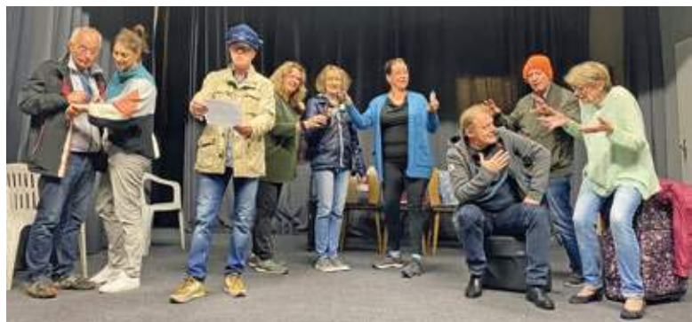
Fleißig geprobt wird gerade auf der Saalbau-Bühne. An fünf Tagen wird im November „Es fährt kein Zug nach Irgendwo“ im Haus Spitz von der Volksbühne Bochum aufgeführt.

Interessierte erreichen die Verkaufsstelle telefonisch unter der Nummer 0234-472387 sowie 0234-94429547 (tagsüber). Die Karten können nur telefonisch reserviert werden – und nicht per E-Mail.