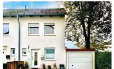
Bochum | Gut angebundenes Reihenendhaus in Hiltrop mit liebevoll angelegtem Garten Wohnfläche: 148 qm, Grundstücksfläche: 202 qm, Baujahr: 2002, 5 Zimmer, Garage, Preis: 499.000 €