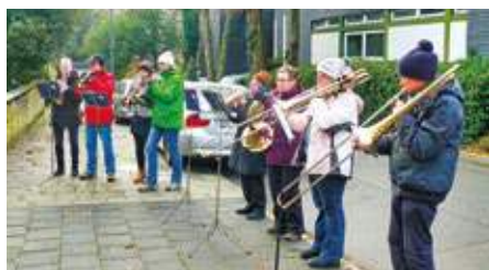
Mit Trompeten, Posaunen, Horn und Tuba spielt der Posaunenchor der Petri-Kirche am 1. Advent.

Der Posaunenchor der Petri-Kirche in der evangelischen Gemeinde Wiemelhausen hat im Sommer seinen 50. Geburtstag gefeiert. Bald führt der Chor die Tradition seines Kurrendeblasens am 1. Advent fort. Am Sonntag, 1. Dezember, hat die Gruppe elf Stationen eingeplant: den Kühnplatz (6 Uhr), den Zedernweg 3/12 (6.20 Uhr), die Paulinenstraße 7b (6.40 Uhr), Am Bleckmannshof 57 (7.10 Uhr), an der Förderstraße (7.30 Uhr), das Altenheim Borgholzstraße (8 Uhr), die Pilgrimstraße 35 bis 40 (8.40 Uhr), der Biermannsweg 27 (9.10 Uhr), das Baumhofzentrum (9.45 Uhr), das Hospiz St. Hildegard (10.15 Uhr) sowie abschließend um 11.10 Uhr den Kuhlehof. Die Trompeten, Posaunen, Horn und Tuba werden Adventslieder wie „Tochter Zion“ oder „Macht hoch die