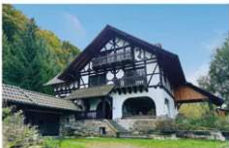
Ennepetal | Liebevoll erhaltene Fachwerk-Villa in Alleinlage umgeben von Wäldern mit atemberaubendem Weitblick Wohnfläche: 260 qm, Grundstücksfläche: 1.280 qm, 9 Zimmer, Baujahr: ca. 1800, Preis: 799.000 €