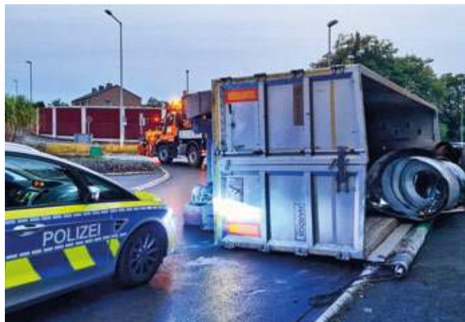
In Stiepel war im Kreisverkehr ein LKW-Sattelaufleger umgekippt.

Innenstadt, Weitmar und der Feuerwache aus. Letztlich musste zunächst nur auslaufendes Hydrauliköl durch die Feuerwehr abgestreut werden, die nach 30 Minuten wieder abrückte. Die Polizei hatte gemeinsam mit Straßen.NRW die Einsatzstelle übernommen. Der umgekippte Sattelaufleger wurde durch ein Bergungsunternehmen aufgerichtet und entfernt. In diesem Zeitraum kam es zu längeren Verkehrsbeeinträchtigungen.