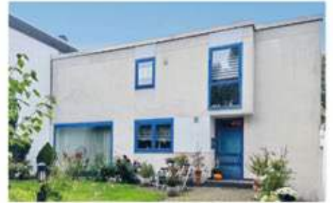
Bochum | Gepflegte Eigentumswohnung am Waldrand von Wiemelhausen mit uneinsehbarer Sonnenterrasse Wohnfläche: 95 qm, 2 Zimmer, Baujahr: 1974, Terrassenfläche: 35 qm, Preis: 239.000 €