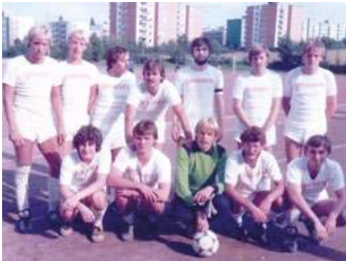
Ein Mannschaftsfoto aus den Anfängen des Vereins, der sich von Anfang an als Vertreter des Breitensports sah.

gart, Berlin, München oder Bremen. Da gibt es immer etwas, das die Vereinsmitglieder der SG Sundern interessiert. Auch viele Jahre Tennis und Fußball im Rahmen des Betriebssportverbandes und die „Alten Herren“, die ihre Spiele auch gegen die entsprechenden Mannschaften des DFB austrugen, waren ein Gesprächsthema. Heute trägt die Fußballmannschaft ihre Spiele wieder im Rahmen der FFLB aus. Die Heimspiele und das Training finden seit einigen Jahren stets am Montagabend auf dem Platz an der Engelsburger Straße statt. Das Jubiläumsfest machte noch einmal deutlich: Es ist überhaupt nicht erstaunlich, dass dieser Verein seit 50 Jahren in Sundern einen festen Platz hat und dieses Ereignis mit so vielen Mitgliedern und Gästen feiern durfte.