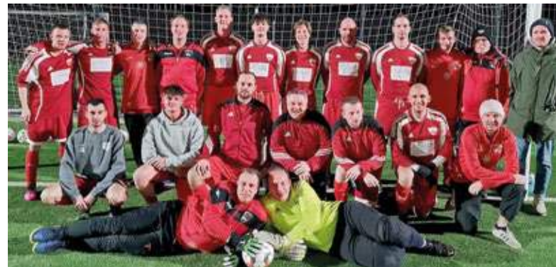
Auch heute ist es ein stolzes Team, das für die SG Sundern ausaufläuft und für ein lebhaftes Vereinsleben steht.