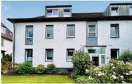
Bochum | Komfortable Eigentumswohnung in begehrter Lage im Ehrenfeld Wohnfläche: 68 qm, 2 Zimmer, Baujahr: 1969, Preis: 299.000 €