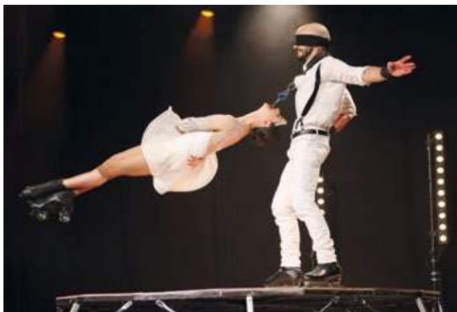
Das Duo Skating Phoenix steht in der Wintershow des Varieté et cetera auf der Bühne.