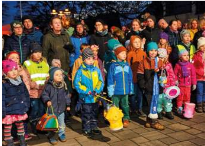
Wie vor einem Jahr beginnt der ökumenische St.-Martins-Umzug an der Stiepeler Dorfkirche.