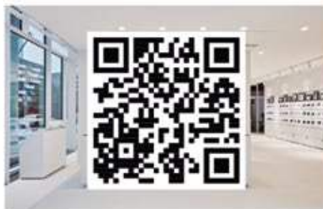
Sie sind auf der Suche nach Ihrer Traumimmobilie? Dann lassen Sie sich in unsere Suchkundenkartei aufnehmen und verpassen ab sofort kein Immobilienangebot mehr. Ihre Suchkriterien können Sie online hinterlegen.