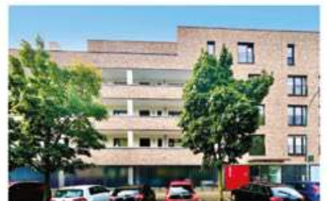
Bochum | Barrierefreie Eigentumswohnung mit TG-Stellplatz und großer Loggia in Altenbochum Wohnfläche: 89 qm, 3 Zimmer, Baujahr: 2009, Aufzug, Tiefgarage, große Loggia, Preis: 379.000 €