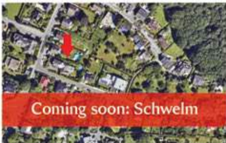
COMING SOON | Schwelm | Repräsentatives Highlight mit Weitblick sucht sanierungsfreudige Käufer Wohnfläche: 240 qm, Grundstücksfläche: 1.090 qm, Baujahr: 1967, uneinsehbarer Garten, Möglichkeit einer ELW, Preis: 760.000 €