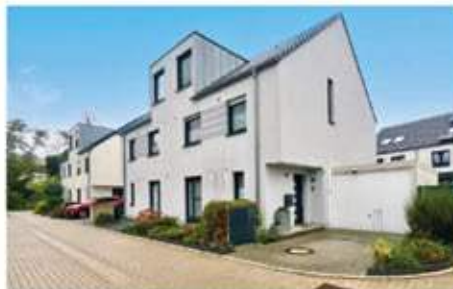
Herne | Familientraum: Moderne, zeitlose Doppelhaushälfte mit Fernwärme im Neubaugebiet Wohnfläche: 145 qm, Grundstücksfläche: 215 qm, 5 Zimmer, Baujahr: 2019, Garage, Preis: 509.000 €