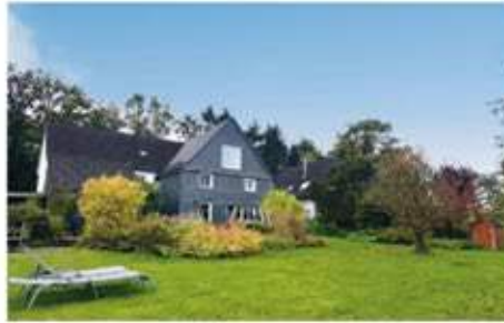
Ennepetal | Traumhaftes Fachwerkhaus in begehrter Alleinlage: Unverbaubarer Weitblick umgeben von Feldern Wohnfläche: 226 qm, Grundstücksfläche: 1.960 qm, 7 Zimmer, Baujahr: ca. 1855, Preis: 639.000 €