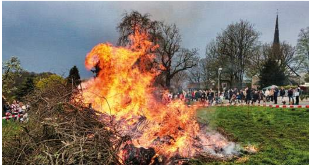
Am Ostersonntag wird auf der Friedhofswiese ein Osterfeuer entzündet.