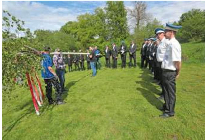
Mitglieder des Stiepeler Schützenvereins werden beim Maifest wieder den Maibaum aufstellen.

Das eigentliche Maifest startet dann am Samstag um 12 Uhr. Mehrere Vereine und Organisationen haben bereits ihr