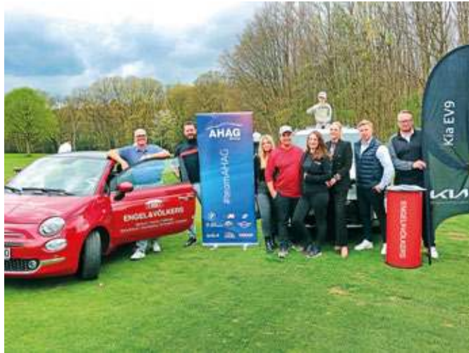
Das Immobilien-Unternehmen Engel & Völkers und das Autohaus AHAG/KIA unterstützen wieder zwei Turnierserien.

Außerhalb der Grüns richtet sich der Fokus der Mitglieder auf den 29. April (Dienstag), wenn im Clubhaus die Mitgliederversammlung auf der Tagesordnung steht. Wichtige Punkte auf der Agenda sind Neuwahlen für den Vorstand und den Beirat. Dabei sind personelle Veränderungen zu erwarten, weil z.B. innerhalb des Beirats einige Mitglieder turnusgemäß nicht mehr zur Wahl stehen.