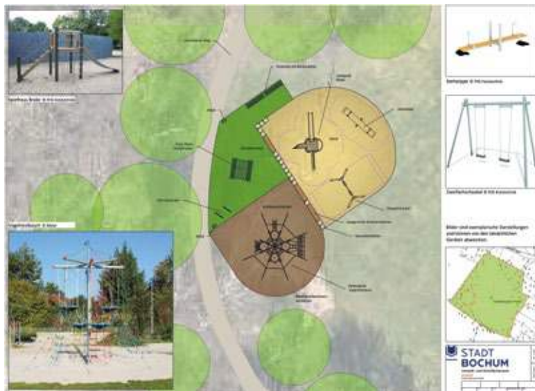
Drei größere Spielgeräte sowie eine Aufenthaltsfläche (in Dunkelgrün) weist der Plan für die Neugestaltung der Spielwiese an der Brockhauser Straße aus. Grafik: Stadt Bochum

hang zueinander stehen.“ In der Beschlussvorlage wird zudem das Projekt begründet. Dort heißt es: „Der Kinderspielplatz an der Brockhauser Straße bietet aufgrund seiner Größe Potenzial, den Stadtteil Stiepel aufzuwerten. Familien im Stadtteil haben diesen Wunsch ebenfalls geäußert, so dass eine Neugestaltung den Spielwert deutlich erhöhen wird.“ Ein Plus für den Neubau der Spielwiese sei zudem die Lage direkt an der Ruhr. Durch das Projekt biete man entlang des Ruhrtrahlradweges eine Rast- und Spielmöglichkeit. Und: Laut Stadtverwaltung leben im Radius von 250 Metern rund um die Wiese 149 Kinder und Jugendliche. 56 im Alter von bis zu sechs Jahren, 64 zwischen sechs und 14 Jahren sowie 29