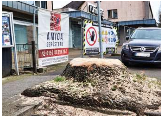
Mitte Februar wurden an der Kemnader Straße zwei Bäume gefällt, einer davon war eine große Eiche.

Auf Höhe des Eingangsbereichs des ehemaligen Möbelhauses musste eine 14 Meter hohe Stiel-Eiche mit einem Stamm-Durchmesser von knapp 40 Zentimeter weichen. Der Stumpf ist durch einen Strauch verdeckt und fällt kaum groß auf. Aus der Planungsvorlage, die der Bezirksvertretung Süd vorliegt, geht hervor, dass dieser Verlust durch die Pflanzung von