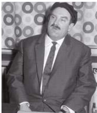
An Ruhrpott-Original Jürgen von Manger wird am 4. April in Wiemelhausen erinnert.