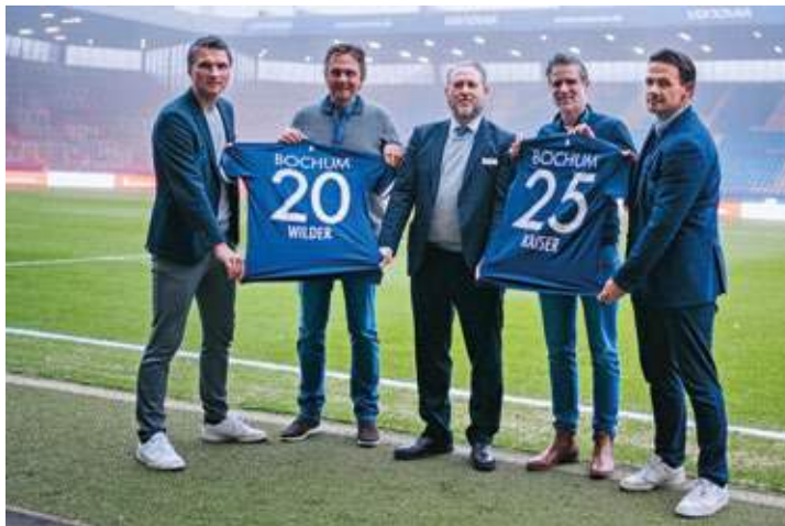
Mit dem Tourismusverband Wilder Kaiser präsentiert der VfL Bochum einen neuen Touristik-Partner, der die Bochumer im Sommer nach Tirol holen wird.

Der VfL und der Tourismusverband Wilder Kaiser bieten interessierten Fans die Möglichkeit, sich über eine gemeinsame Webseite über Unterkünfte, Veranstaltungen und Aktivitäten in der Region zu informieren und direkt über die gemeinsame Plattform alle Angebote zu buchen. So sind mitreisende Fans nicht