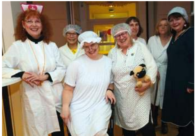
Die Frauengruppe führte Sketche auf.