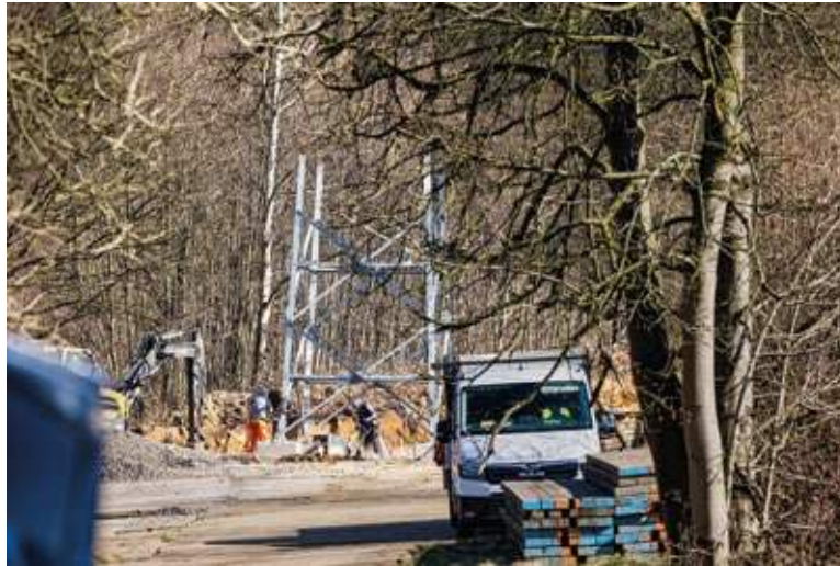
Seit einigen Wochen wird an dem am Ende 31 Meter hohen Mobilfunkmast an der Kosterstraße gearbeitet.

„Die Kosten für einen neuen Mobilfunkmast variieren stark in Abhängigkeit von den baulichen Rahmenbedingungen und liegen im Durchschnitt bei etwa 300.000 Euro“, berichtet DFMG-Pressesprecherin Lena Naber. Aktuell hat die Telekom mehr als 36.000 Mobilfunkstandorte in Betrieb. Zusätzlich baut das Unternehmen jährlich über 1.000 neue Standorte. In Stiepel betreibt die Deutsche Funkturm GmbH neben dem neuen Mast drei weitere Standorte selbst – auf Dächern, wie etwa in Frische. Durch den Neubau werden Funklöcher ausgemerzt. Der neue Mast liegt recht nahe am zu versorgenden Gebiet. Es gibt keine signifikanten Hindernisse zwischen dem Standort und dem Versorgungsgebiet. „Der Standort an der Kosterstraße erfüllt die