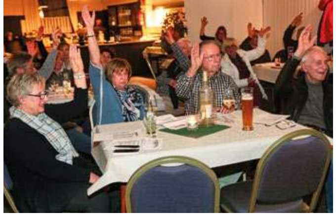
37 von knapp 280 Mitgliedern waren bei der Jahreshauptversammlung des Stiepler Vereins für Heimatforschung im Haus Spitz.