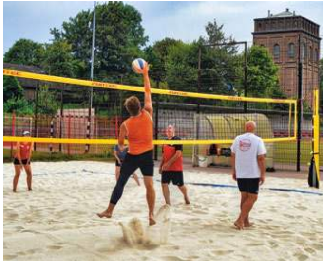
Die Beachvolleyball-Anlage an der Glücksburger Straße soll um ein zweites Feld erweitert werden.

Seit über einem Jahrzehnt ist die Beachvolleyball-Abteilung ein wichtiger Bestandteil des Vereins. Im Juli 2014 wurde das erste Beachvolleyball-Feld eingeweiht. Aufgrund der wachsenden Zahl an Sportbegeisterten in der Abteilung ist die Nutzung des