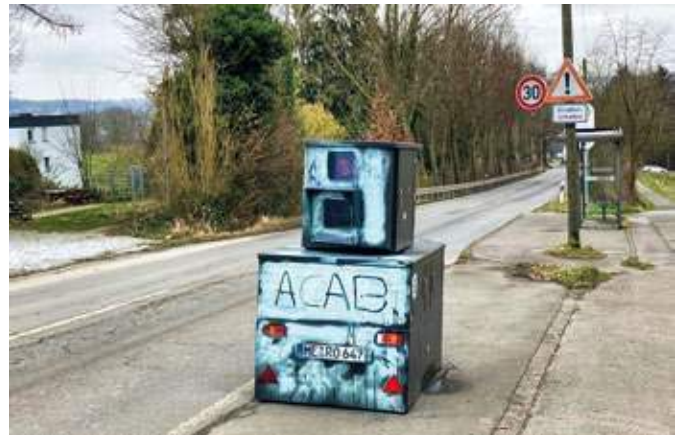
Mit Farbe überzogen war ein mobiler Blitzer auf der Kernader Straße und war daher zeitweise „blind“.