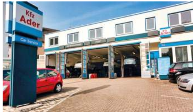
Kfz Ader an der Hattinger Straße 182.

Selbstständigkeit. Der Mut wurde schnell belohnt, immer mehr Autofahrer aus ganz Bochum vertrauen Kfz Ader: „Es ist schön zu sehen, dass Kompetenz, Fachlichkeit und Arbeits-