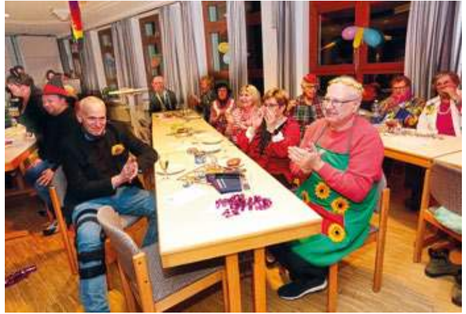
50 Mitglieder der katholischen Kirchengemeinde St. Marien feierten Karneval im Gemeindehaus.