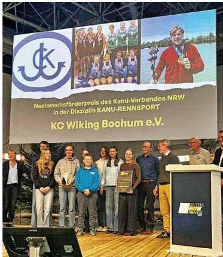
Das Team des KC Wiking war bei der Verleihung des Nachwuchsförderpreises während der Boot-Messe Düsseldorf auf der großen Bühne und auf der großen Leinwand zu sehen.

Besonderer Dank gilt auch dem Kanu-Verband NRW, der mit der Verleihung des Nachwuchsförderpreises das Engagement des Vereins honoriert und somit die Bedeutung der Jugendarbeit in dieser Sportart unterstreicht. Mit dieser Auszeichnung sieht sich der Kanu-Club Wiking Bochum in seinem Kurs bestätigt: Die Förderung junger Sportler bleibt ein zentrales Anliegen, um den Kanusport auch in Zukunft erfolgreich zu gestalten.