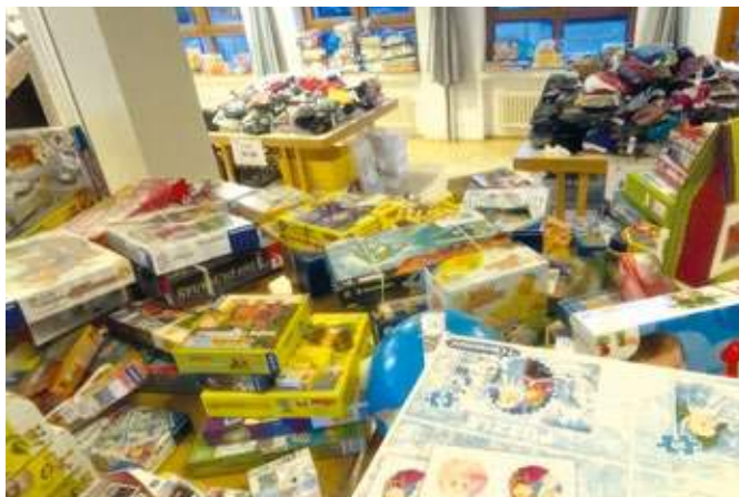
Im Pfarrheim St. Marien findet am Samstag, 15. März, ein Flohmarkt statt.

Zum vierten Mal binnen weniger Monate organisiert der Förderverein der Gräfin-Imma-Schule in Stiepeler einen Flohmarkt. Es ist mittlerweile der 19. dieser Art. Schauplatz am Samstag, 3. Mai, ist zwischen 10 und 13 Uhr das Pfarrheim St. Marien (Am Varenholt 15). Einlass für Schwangere mit Mutterpass ist um 9.30 Uhr. Verkaufende bieten ihre Sachen nicht selbst an, sondern bewerben sich per Internet für die Teilnahme und bringen ihre Ware (gut erhaltene Kleidungsstücke der Größen 116 bis 182, Kinderspielzeug – keine Kuscheltiere, Monster, Kriegsspielzeug, Gewaltspiele für PS und Computer – Bücher, Spiele und Puzzle) am