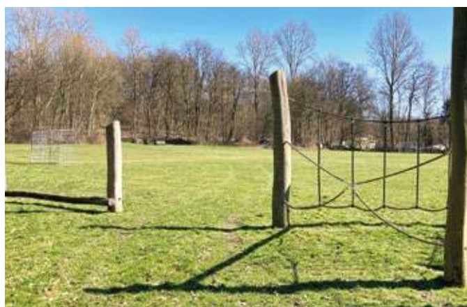
Nur wenige Spielgeräte – in einer Ecke der Wiese – gibt es bislang an der Brockhauser Straße.

zwischen 14 und 18 Jahren. Der Spielplatz liegt am Fußweg, der aus Stiepel-Dorf hinunter zur Ruhr führt. An dem Weg ist eine neue Aufenthaltsfläche aus Schotterrasenfläche vorgesehen – mit zwei Sitzbänken sowie einer Tisch-Bank-Garnitur, zwei Abfallbehältern sowie zwei Anlehnbügel für Fahrräder. Auf dem neu gestalteten Spielbereich wird es einen Sandspielbereich mit Sandspiel-Rutschen-Kombination, einer Stehwippe und einer Holzhackschnitzelfläche mit einem hohen Seil-Netz-Klet-