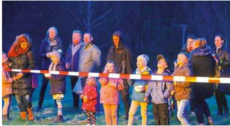
Ein beliebter Treffpunkt ist das Mittelstiepler Osterfeuer, das am Gründonnerstag an der Ziegenbockstation in Stiepel entzündet wird.

gleichsschießen des Jahres findet am Sonntag, 6. April, auf dem Stand der Kompanie Mailand statt.