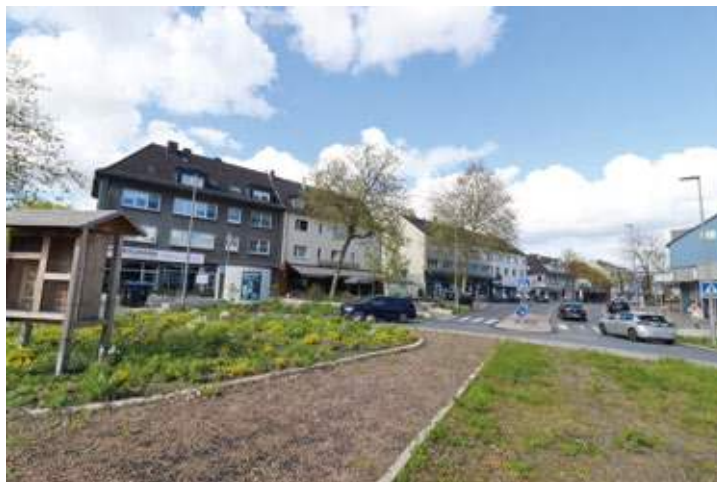
Am Kreisverkehr im Herzen von Weitmar-Mark feiert die Werbegemeinschaft das zweite Frühlingsfest.

ges Programm für Jung und Alt. Geplant sind unter anderem Auftritte von Clowns und