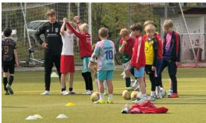
Die Feriencamps von RW Stiepel erfreuen sich großer Beliebtheit bei den jungen Fußballern.

Die Camps verbinden sportliche Förderung mit viel Spaß und Gemeinschaft. Neben intensiven Trainingseinheiten, in denen Technik, Koordination und Teamverhalten geschult werden, stehen auch spielerische Elemente und gemeinsame Aktivitäten im Vordergrund. Ziel ist es, den jungen Teilnehmerinnen und Teilnehmern nicht nur fußballerische Inhalte zu vermitteln, sondern vor allem die Freude am Sport und das Miteinander im Verein zu stärken. Besonders geschätzt wird dabei die professionelle Or-