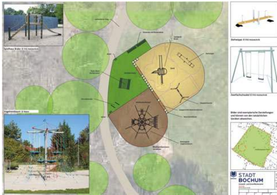
Drei größere Spielgeräte sowie eine Aufenthaltsfläche (in Dunkelgrün) weist der Plan für die Neugestaltung der Spielwiese an der Brockhauser Straße aus.

Auf der 10.755 Quadratmeter großen Fläche stehen derzeit – eigentlich eher am Rand – eine Schaukel und zwei massive Tore zum Fußball spielen. Zudem gibt es Klettermöglichkeiten. Daher ist der Kinderspielplatz aktuell eine Ansammlung einzelner Geräte, die in keinem räumlichen Zusammenhang zueinander stehen und am Rand der großen Wiesen-