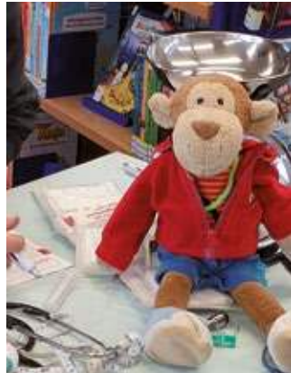
Die Teddyklinik hilft auf spielerische Weise Kindern, Ängste vor Untersuchungen und Arztbesuchen abzubauen.

handlung und es gab Spritzen, Pflaster und Verbände. In der Apotheke erhielten die Besitzer der „Patienten“ gute Ratschläge, was noch zur schnellen Besserung beitragen kann, etwa Kuschneln, Geschichten vorlesen, ge-