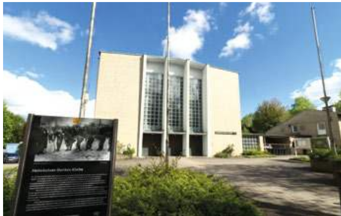
In der Heimkehrer-Dankeskirche in Weitmar-Mark wird an das Ende des Zweiten Weltkriegs erinnert.

Für die Christlich-Demokratische Arbeitnehmerschaft (CDA) Ruhr und Bochum ist dieser Tag daher nicht nur Anlass zum Gedenken, sondern auch ein klarer Auftrag: Frieden, Freiheit und Menschenwürde aktiv zu verteidigen. Mit einer Gedenkveranstaltung am Freitag, 8. Mai, um 19 Uhr lädt die CDA an einen Ort ein, der wie kaum ein anderer für Erinnerung und Versöhnung steht: die Heimkehrer-Dankeskirche an der Karl-Friedrich-Str.