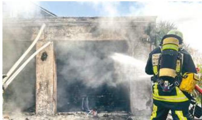
Einen Garagenbrand in Stiepel musste die Feuerwehr unter Kontrolle bringen. Im Einsatz war auch der Löschzug Stiepel der Freiwilligen Feuerwehr.

Im Einsatz waren Kräfte der Feuerwache Innenstadt und Weitmar sowie die Freiwilligen Feuerwehr Stiepel.