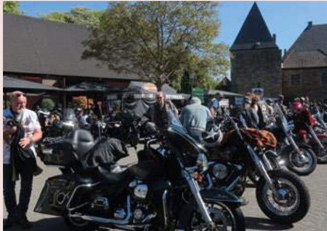
Im Zeichen der Marke Harley Davidson steht Burg Kemnade wieder beim Ruhrpott Run am 1. Mai.

cher dürfen wieder die bewährte Mischung aus Motorrad, Musik und Charity erwarten, für die das Bochumer Harley-Davidson-Chapter federführend ist. Deshalb hoffen die Verantwortlichen auf gute äußere Bedingungen, damit blitzender Chrom und Schlosskulisse wieder eine spektakuläre Einheit bilden.