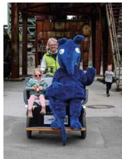
Rikscha-Fahrten mit der blauen Ratte, dem Maskottchen des LWL-Museums Henrichshütte, sind während des Familienfestes möglich.