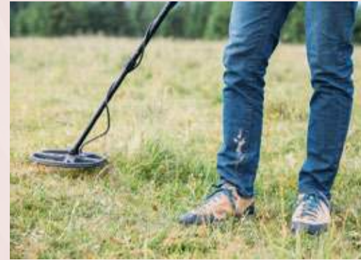
Ein Sondengänger hat in Stiepel mehrmals wertvolle Funde aus der Römerzeit entdeckt.

Geschichte 2 ist hingegen wahr. Ein seit langem in Stiepel aktiver und mit den Örtlichkeiten bestens vertrauter Sondengänger hat den beschriebenen Delphin tatsächlich entdeckt. Und das in einem Bereich, einer typischen Siedlungslage oberhalb der Ruhr, in dem er auch schon eine römische Mars-Statuette gefunden hat. Beide Objekte werden im Westfälischen Landesmuseum für Archäologie und Kultur in Herne ausgestellt. Die beiden Funde sind jeweils einzigartig und von besonderer Bedeutung für unsere Region. Der Delphin aus reiner Bronze war üblicherweise als Statussymbol und Glücksbringer an römischen Reisewagen zu finden. Geplant ist, dass Sondengänger Christoph Hirt in diesem Sommer in den Räumlichkeiten des Stiepeler Heimatvereins einen Vortrag hält und dabei seine interessantesten Fundstücke aus Stiepel (nicht nur die römischen) vorstellt. Der Termin wird in einer der folgenden Ausgaben des Stiepeler Boten bekanntgegeben. Rückblick wahre Geschichte: