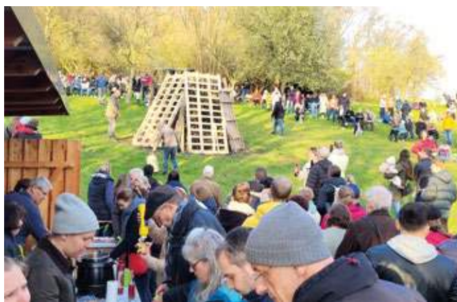
Das Osterfeuer des Stiepeler Vereins für Heimatforschung zog wieder viele Menschen zur Pfingstblume.