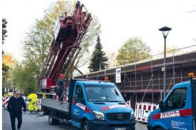
Der TC Südpark führt eine umfassende energetische Sanierung seines Vereinshauses und der Tennishalle durch.

2021 gründete der TC Südpark den Arbeitskreis „Energie Force“, in dem Mitglieder aus verschiedenen Fachrichtungen Ideen und Konzepte zum Energie-Einsparen entwickelten. Ursprünglich plante der Verein zunächst den Bau einer Photovoltaikanlage und eines Batteriespeichers. Doch die Energiekrise brachte neue Herausforderungen und zeigte: Auch Gebäudehülle und Heiztechnik müssen dringend modernisiert werden. Gemeinsam mit