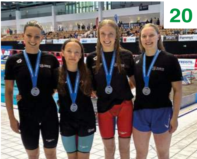
Silber für die Lagenstaffel