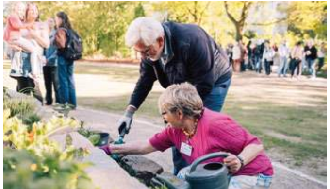
Oberbürgermeister Jörg Lukat hat den neuen Pocket Park offiziell eröffnet.

Das Seniorenbüro Mitte sucht in Kooperation mit dem Ehrenfelder Miteinander Ehrenamtliche, die Zeit und Lust haben, einmal pro Woche für eine Stunde einen Stadtteilspaziergang im Ehrenfeld für Menschen mit eingeschränkter Lauffähigkeit zu leiten. Die Patinnen und Paten sollten selbst gerne an der frischen Luft unterwegs sein – gerne auch mit dem Rollator. Der Spaziergang kann auch mit einem gemeinsamen Abschluss in einem Café oder eine Bäckerei enden. Interessierte können sich beim Seniorenbüro Mitte melden unter Tel.: 0234-92786390.