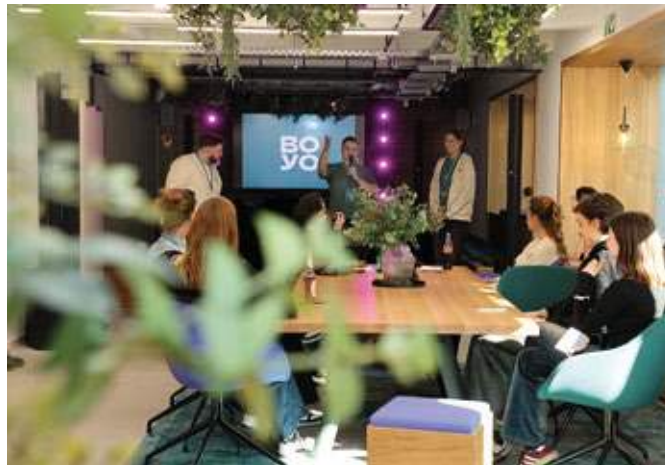
Einen neuen Treffpunkt für junge Menschen hat die Sparkasse Bochum mit BOYO geschaffen.