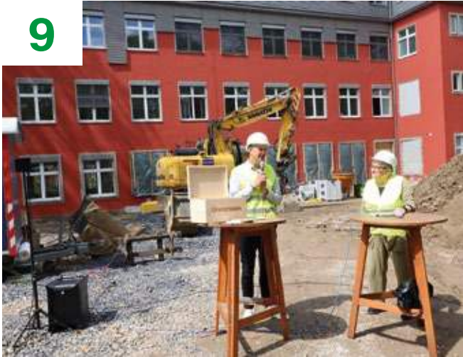
Grundstein für Kindertagesstätte gelegt