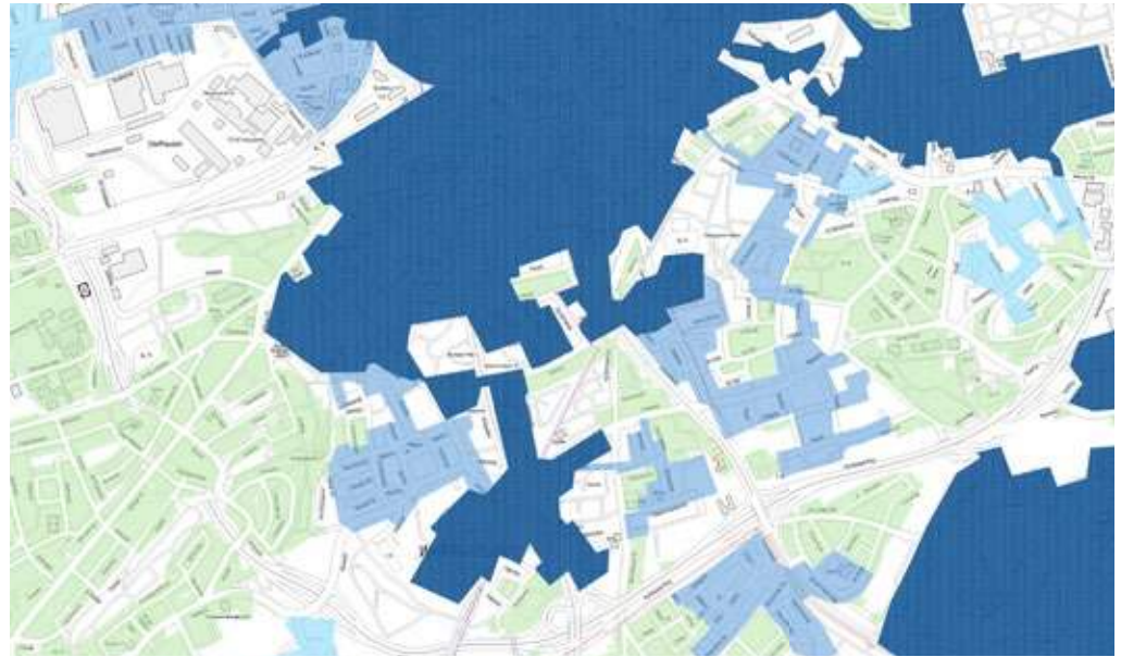
Die Übersichtskarte verdeutlicht: Fast überall im Ehrenfeld ist Fernwärme schon jetzt verfügbar (dunkelblau). Das Gebiet an der Danziger Straße ist als Ausbauggebiet (hellblau) gekennzeichnet. Für die grün gekennzeichneten Flächen werden andere Techniken zum Zuge kommen. Grafik: Stadtwerke

Welche Gebiete für die Fernwärme in Frage kommen, haben die Stadtwerke auch auf einer Karte dargestellt, im Ehrenfeld ist die Versorgung fast flächendeckend möglich. Vorteile der Fernwärme sind die relativ günstigen Investitionskosten gegenüber einer Wärmepumpe. Eine Fernwärme-Hausstation gibt es schon ab etwa 5.000 Euro. Eine strombetriebene Wärmepumpe ist da wesent-