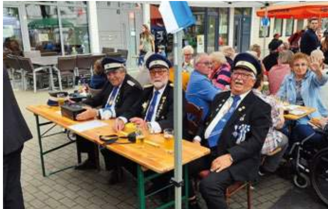
Auch wenn das Wetter beim BSV-Biwak nur zeitweise mitspielte, gab es ein zünftiges Stelldichein auf dem Kirchviertelplatz.

Am Samstag gab es dann immer mal wieder starken Regen. In der Zeit von 11 bis 16 Uhr gab es für Kinder Unterhaltung durch die Feuerwehr Querenburg. Diese hatte eine Spritzwand und einen Parcours für Tretautos aufgebaut und Interessierte durften auch ein großes Löschfahrzeug besichtigen. Zum kulinarischen Angebot gehörten neben Krakauer,