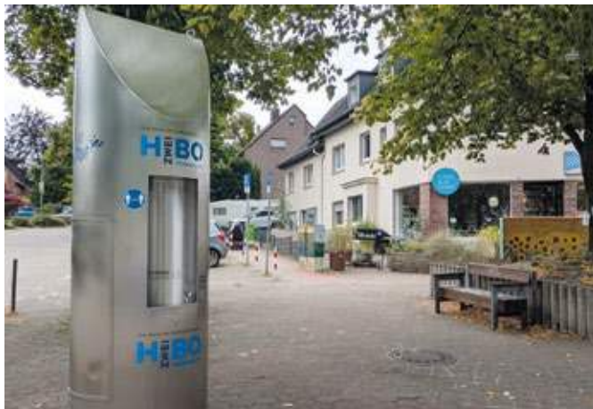
Auch im Kirchviertel an der Glücksburger Straße Ecke Brenscheder Straße können Bürgerinnen und Bürger ihre Flaschen mit frischem Trinkwasser füllen.

Am Bochumer Hauptbahnhof, am Alten Markt in Wattenscheid sowie im Kirchviertel an der Glücksburger Straße Ecke Brenscheder Straße können Bürgerinnen und Bürger ab sofort ihre Flaschen mit frischem Trinkwasser füllen. Erstmals in diesem Jahr werden die Stadtwerke außerdem einen mobilen Trinkwasserspender am Kemnader See in der Nähe des