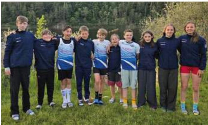
Mit seiner Schülermannschaft nahm der KC Wiking aus Stiepel erfolgreich an der Regatta in Saaldorf teil.

Der KC Wiking blickt damit auf ein äußerst erfolgreiches Pfingstwochenende zurück und freut sich über zahlreiche Medaillen sowie die WM-Qualifikation einer seiner Nachwuchsatletinnen.