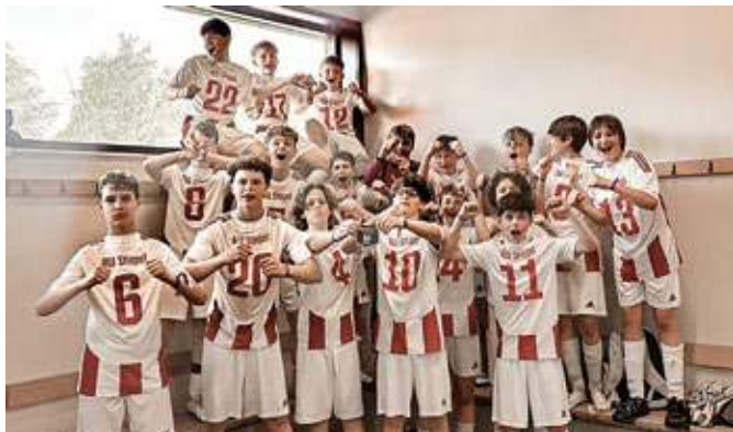
Nach dem 1:0-Sieg gegen Groß Flottbek starteten die Stiepler Ujungs die Kabinenparty.

Stocksund. Die 0:3-Niederlage war zwar deutlich, doch die Schweden spielten „gefühl in einer anderen Liga“. Der emotionale Höhepunkt des ersten Turniertages folgte im entscheidenden Spiel gegen die Groß Flottbeker Spielvereinigung. Die Ausgangslage war klar: Nur mit einem Erfolg würde die Mann-