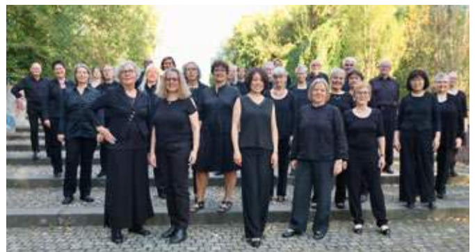
Der Neue Chor der Stadt Bochum zeichnet sich durch seine Offenheit für alle Arten anspruchsvoller Chormusik aus.