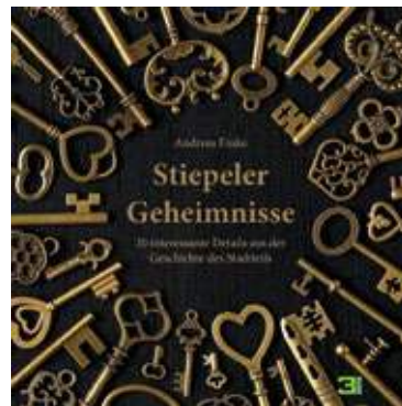
Das Buch „Stiepeler Geheimnisse“ ist Vorlage für die Wanderung.