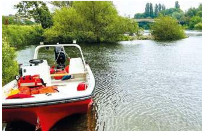
Einsatzkräfte der Berufsfeuerwehr, der DLRG Süd sowie der Polizei waren am Ruhr-Ufer in Stiepel im Einsatz.

Eine zufällig vorbeikommende Fahrradfahrerin, die selbst Ärztin ist, erkannte die Situation sofort und griff beherzt ein. Es gelang ihr, alle vier Personen aus dem Wasser zu retten. Zum Zeitpunkt der Rettung war eine der Frauen bereits bewusstlos. Die Ärztin begann bei ihr sofort mit Erste-Hilfe-Maßnahmen. Parallel dazu wurde durch ein weiteres Familienmitglied die nahegelegene DLRG-Station Bochum-Süd alarmiert. Die