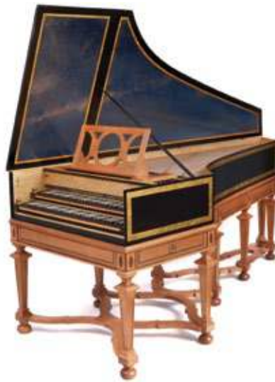
Das Cembalo steht diesmal im Mittelpunkt der Kulturreihe „Musik und Psalm“ in der Stiepeler Dorfkirche.

Das Cembalo ist von der Spielweise her ein Tasteninstrument, die Saiten werden durch einen Kiel angezupft und nicht wie beim Klavier mit