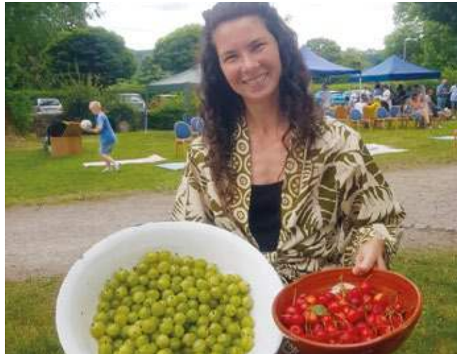
Die evangelische Kirchengemeinde feiert wieder das Johannisfest an der Dorfkirche.

Für die musikalische Gestaltung des Gottesdienstes und Unterhaltung beim Fest sorgen unter anderem der CROSS-Chor, das Weltmusik-Ensemble Cosmopottski und der Posaunenchor. Für Speis und Trank sowie Spiel und Spaß für die ganze Familie – unter anderem beim Kränzebinden, Lesezeichen-Basteln und auf der