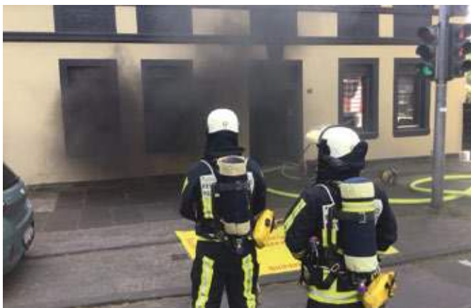
Ein Trupp unter Atemschutz ging mit einem C-Rohr zur Brandbekämpfung in der Wohnung an der Karl-Friedrich-Straße vor.

auf Rauchgasvergiftung vom Rettungsdienst versorgt werden, die weiteren Bewohner wurden betreut. Rund 40 Mitarbeiter von Feuerwehr und Rettungsdienst waren im Einsatz, die Löscheinheit Stiepel unterstützte dabei die Kollegen der Berufsfeuerwehr.