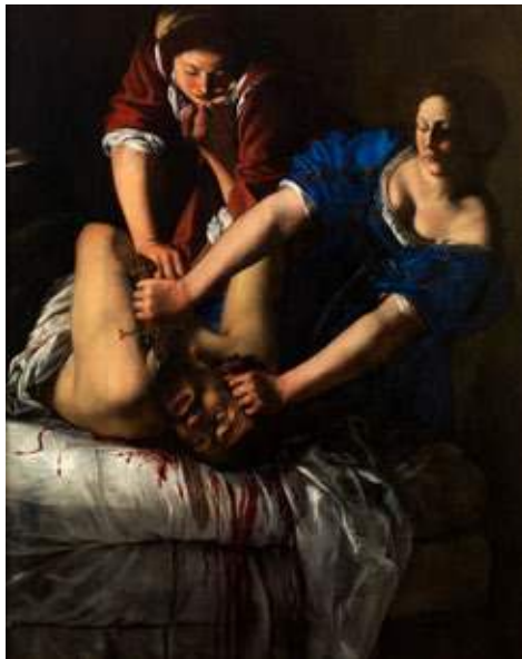
Das Gemälde von Artemisia Gentileschi zeigt die Enthauptung von Holofernes durch Judith nach dem apokryphen alttestamentlichen Buch namens „Judith“:

Ab dem ersten Gottesdienst in den Sommerferien am 19. Juli bis zum letzten am 30. August werden in den Gottesdiensten im Ev. Hustadtzentrum und im Thomaszentrum (Kirchengemeinde Querenburg), im Baumhofzentrum und in der Melanchthonkirche (Kirchengemeinde Bochum-Wiemelhausen) sowie in der Stiepeler Dorfkirche und im Lutherhaus (Kirchengemeinde Stiepel) biblische Texte thematisiert, in denen „Verbrechen“ zur Sprache kommen, so eine der möglichen Übersetzungen des