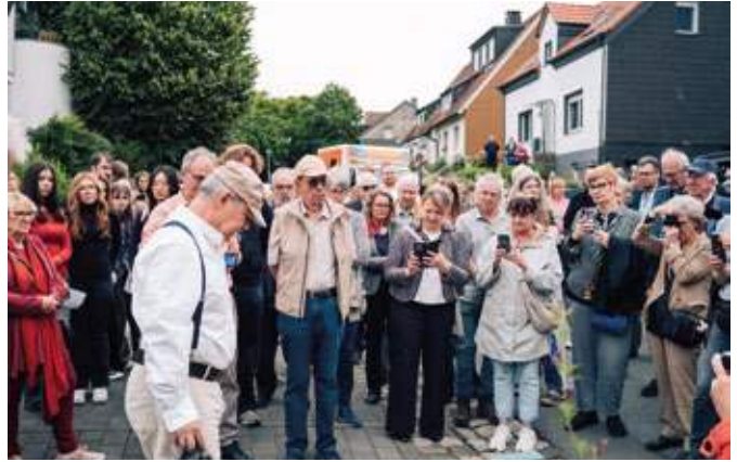
Über 100 Menschen hatten sich in der Gräfin-Imma-Straße versammelt, um Künstler Gunter Demnig bei der Stolperstein-Verlegung zuzusehen.