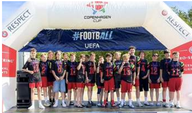
Großer Auftritt auf der internationalen Bühne: Die C2-Junioren von RW Stiepel beim Copenhagen Cup 2026.

schaft am zweiten Turniertag an weiteren Platzierungsspielen teilnehmen dürfen. Die Spieler waren bis in die Haarspitzen motiviert. Mit großem Einsatz, Leidenschaft und mannschaftlicher Geschlossenheit erkämpfte sich Rot-Weiss Stiepel einen viel umjubelten 1:0-Sieg. Als der Schlusspfiff ertönte,